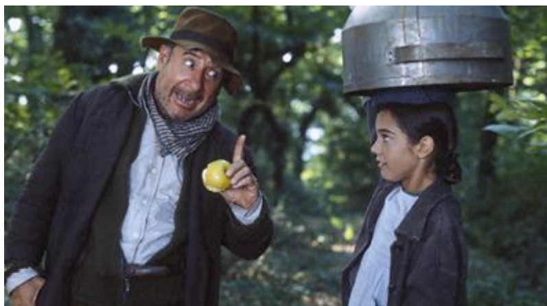
Fig. 11. Escena de El bosque animado , 1987

se completó la trilogía del humor absurdo como elemento común, que se había iniciado en 1983 con Total .