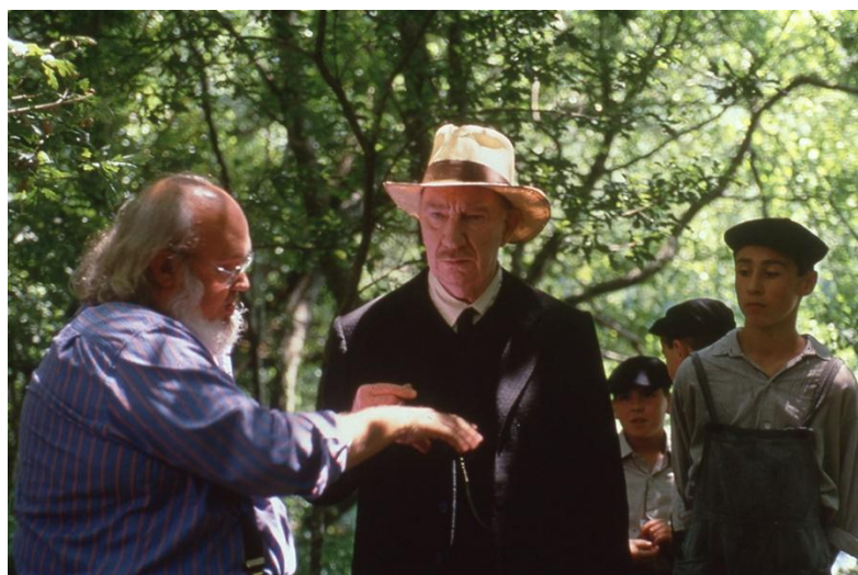
Fig. 9. José Luis Cuerda en el rodaje de La lengua de las mariposas , 1999

En este contexto debe situarse la producción de José Luis Cuerda. El director nació un 18 de febrero de 1947 en Albacete, aunque su familia era de Masegoso, en plena sierra de Alcaraz. 28 Su infancia transcurrió en la ciudad de Albacete, hasta que se marchó debido a que su padre, jugador profesional de póker, había ganado una casa en Madrid. Como director, sus películas más conocidas son La lengua de las mariposas [Fig.9], adaptación de una narración de Manuel Rivas, y la trilogía del “surruralismo”, formada por Total , Amanece, que no es poco y Así en el cielo como en la tierra .