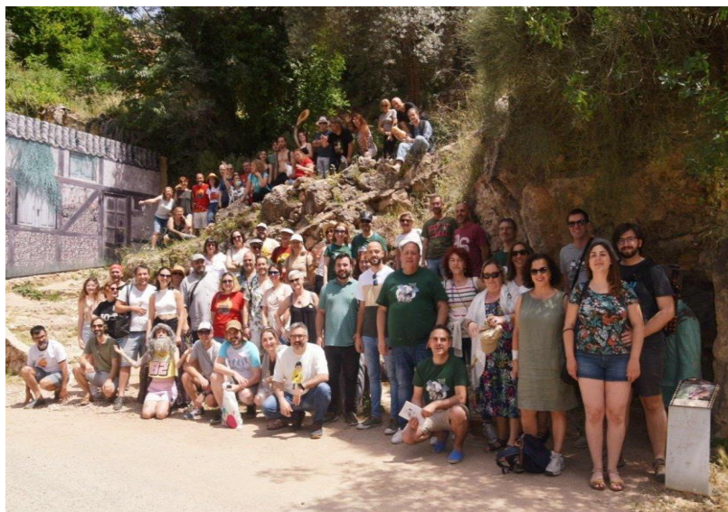
Fig. 17. Décima quedada amanecista, 2022

de nuestro país. Al contrario, José Luis Cuerda estaba presentándonos una película ambientada en pequeños pueblos y protagonizada por personajes sacados de la España profunda. Actualmente, se considera película de culto y su director nunca más ha vuelto a mostrar algo tan único. Fue tal la repercusión que tuvo esta película, que en 2013 se constituyó la asociación Amanecistas, 52 que promueve la difusión de la película Amanece, que no es poco , así como del resto de la obra del director [Fig. 17].