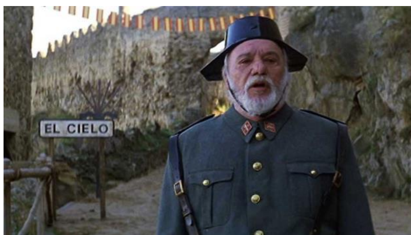
Fig. 25. San Pedro, 1995

Como el papel de Dios que es igual que el de un alcalde, o el de San Pedro que es un guardia civil [Fig. 25]. La historia va guiada por Matacanes, un señor de avanzada edad, que ha sido el primer muerto del apocalipsis. Este será el que nos vaya descubriendo este mundo absurdo, desde la perplejidad que le causa lo que va conociendo, como la imagen de Jesucristo [Fig. 26], que en el film se representa como una persona bajita y muy normal, y no como en las representaciones típicas religiosas. Esta es una de las grandes contradicciones, que usa como argumento humorístico principal en Jesús.