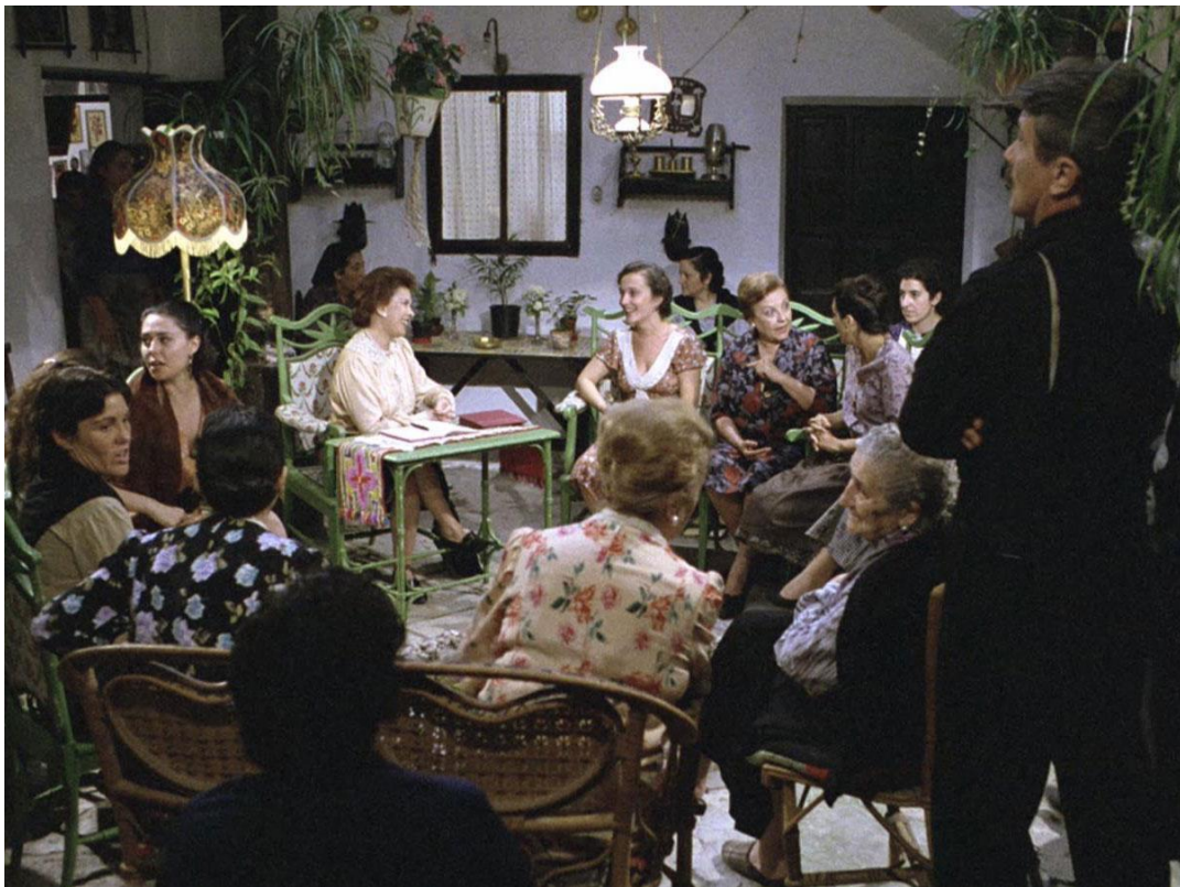
Fig. 24. Asamblea de mujeres en Amanece, que no es poco , 1989

Y es que si algo tiene claro Cuerda es que éste es un país en el que todos nos burlamos de todos y de todo; una sociedad que lleva impresa en su código genético una comicidad basada en reírnos de aquello que más y mejor nos caracteriza.