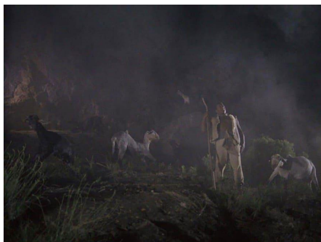
Fig. 16. Escena de Amanece, que no es poco , 1989

semanas se contaba con un veterinario del pueblo que se encargaba de cuidar a los animales que aparecían. Se decidió que, en lugar de poner animales reales, este veterinario determinase cuántas cabras iban a fallecer pronto (por enfermedad) para sacrificarlas y disecarlas. Finalmente, las mataron, pero no las disecaron. Por cuestiones de presupuesto, producción determinó que salía mucho más barato congelarlas. El problema es que no contaron con que el rodaje duraría toda la noche, y en plena grabación comenzaron a descongelarse, apreciándose en el metraje final como una de ellas empezó a descomponerse [ Fig. 16]. 50