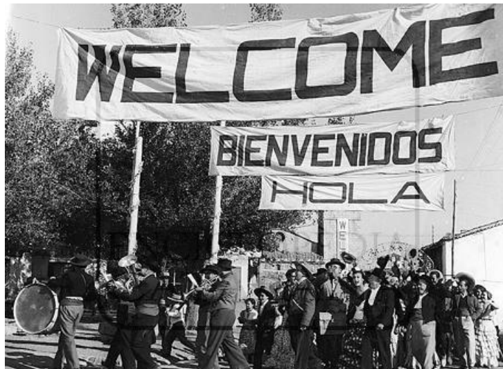
Fig. 14. ¡Bienvenido Mister Marshall! , 1952

porque ya las hacía él y nadie las iba a hacer mejor.” 39 Sin embargo, tiene un claro referente en los pueblos reproducidos por las comedias del cine español de los años cincuenta y sesenta, homenajeando explícitamente a Luis García Berlanga, en concreto con ¡Bienvenido, Mister Marshall! de 1952 [Fig. 14]. 40