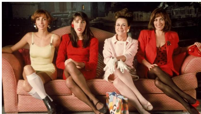
Fig. 4. Mujeres al borde de un ataque de nervios , 1988

comedias de trasfondo melodramático, que han impulsado el cine español internacionalmente, como Mujeres al borde de un ataque de nervios de 1988 [Fig. 4].