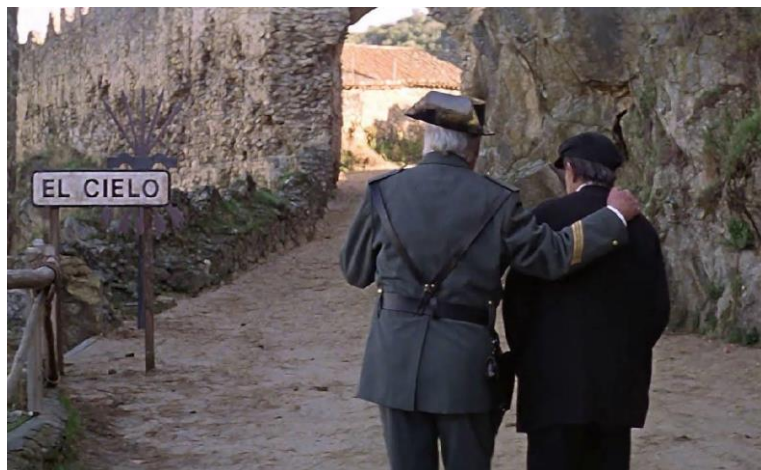
Fig.18. Escena de Así en el cielo como en la tierra , 1995

Su estreno fue el 3 de noviembre de 1995, la crítica la definió como una comedia popular y terrenal, de comicidad campechana y surrealista, nada blasfema, aun tratándose de las sagradas escrituras, pero con un ímpetu provocador que choca directamente con un guión amojamado y desordenado, que va perdiendo fuelle tal como transcurre las escenas. 54