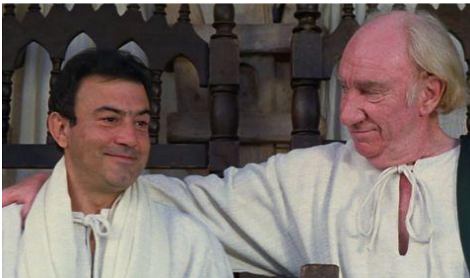
Fig. 26. Jesucristo y Dios en Así en el cielo como en la tierra , 1995

En este universo que crea les atribuye a estos habitantes del cielo, los mismos problemas con los que se encuentran las personas de la tierra. El mismo Dios padre, quiere tener un segundo hijo para intentar hacer las cosas de otra forma y que le vaya mejor, este es un problema que hemos visto en la realidad cotidiana en las familias. Y el papel de Jesús como hijo celoso, que no quiere otro hermano y convence a su progenitor que con el Apocalipsis es suficiente.