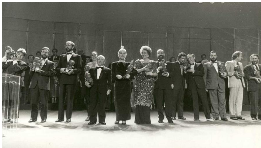
Fig. 2. Premiados de los primeros premios Goya, 1987

Grandes logros fueron Volver a empezar (1982) de José Luis Garci, que se alzó con el Óscar a mejor película extranjera [Fig. 3], o Los Santos Inocentes (1984) adaptada por el director Mario Camus.