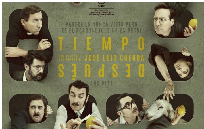
Fig. 13. Cartel de Tiempo después , 2018

Tiempo después , estrenada el 28 de diciembre de 2018, donde nos presenta un futuro post-apocalíptico, en el año 9177 [Fig. 13]. 36