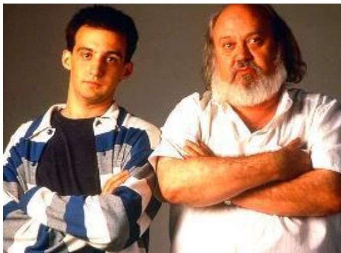
Fig. 12. Alejandro Amenábar y José Luis Cuerda, 2004

También destaca en su papel de productor cinematográfico, haciendo este trabajo en varios de sus obras y en tres de los primeros largometrajes del director Alejandro Amenábar, Tesis , Abre los ojos (1997) y Los otros (2001) [Fig. 12]. 35