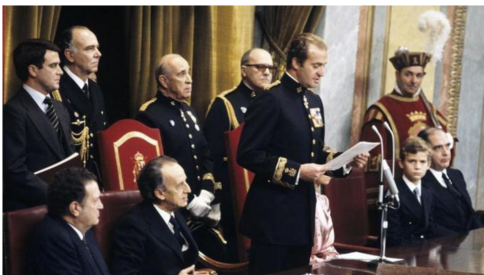
Fig. 1. El rey Juan Carlos I sanciona la Constitución española ante las Cortes Generales, 1978

El cine español se deshizo de la traba de la censura franquista después de la aprobación de la Constitución en 1978 [Fig. 1]. Aun así, quedaba mucho por lo que trabajar. A estas alturas, hay que enumerar dos acontecimientos trascendentales que influyeron notablemente en la evolución de la industria del cine en España: la muerte de Francisco Franco en el año 1975 y las primeras elecciones legislativas que se celebraron el 15 de junio del 1977. El 11 de noviembre de ese mismo año, por orden del ministerio, se suprimió la censura. Durante esta etapa de transformación político-social hubo intentos reaccionarios, pero la democracia ya era una realidad. 17