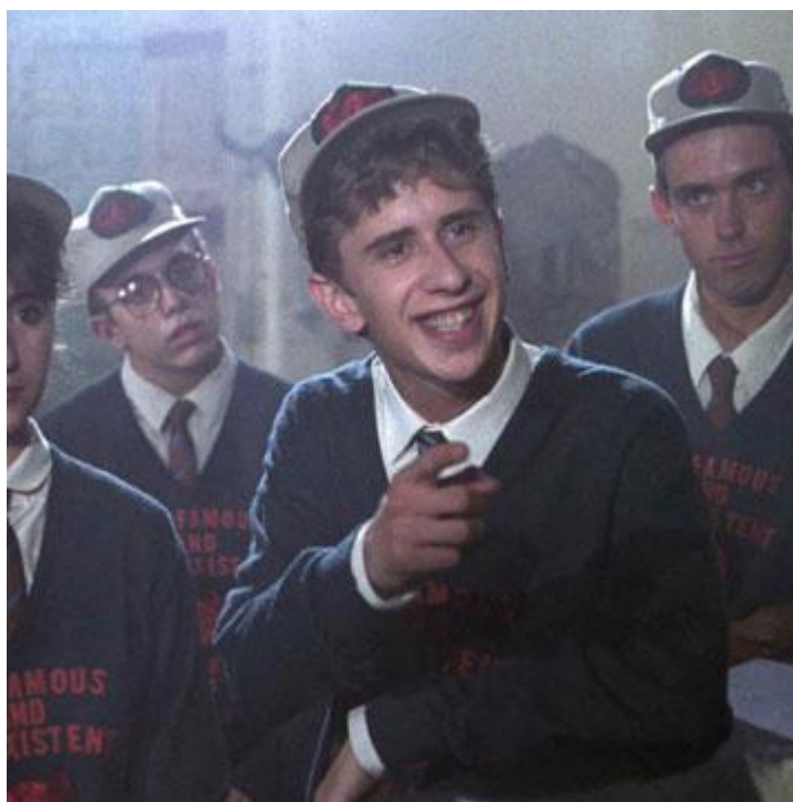
Fig. 23. Gabino Diego en Amanece, que no es poco , 1989

último franquismo, la mujer exuberante que exalta los ánimos masculinos, los habitantes llegan a pedir que “la muchacha sea comunal”, en clara referencia irónica a la rijosidad de aquellos otros filmes, no solo es española, sino que además, pese a ser de Santander, simula un acento andaluz, en referencia a Andalucía como la esencia de la españolidad y en un claro guiño a Bienvenido Mr. Marshall . 60 No es el único momento de la película en que un acento fingido se utiliza para ridiculizar el concepto de identidad, como demuestra Gabino Diego con su exagerada entonación norteamericana, que será el rasgo que le caracterice a lo largo de toda la película 61 [Fig. 23].