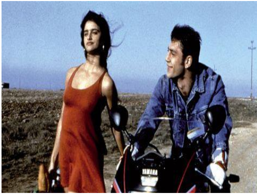
Fig. 6. Penélope Cruz y Javier Bardem en Jamón, jamón , 1992

continúan cosechando logros, consiguiendo el Óscar con Belle époque en 1992 y Todo sobre mi madre en 1999.