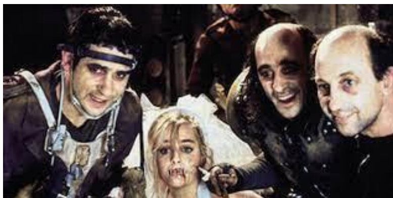
Fig. 8. Acción Mutante , 1993

La nueva generación de realizadores que aparece, se siente interesada por una naciente sociedad española, por la reconversión económica y social. Entre estos destaca Julio Médem y sus estructuras narrativas poéticas, con un lenguaje estético propio, esto se aprecia en obras como Vacas (1991) y Tierra (1996). 21 A su vez encontramos la aclamada Tesis (1996) en el género de thriller de Alejandro Amenábar, unos de los directores españoles más internacionales. De relevancia fue también el cine fantástico, que ha tenido como estandarte a Alex de la Iglesia a partir de Acción Mutante de 1993 [Fig. 8]. 22 Posee grandes influencias de Hitchcock, la cultura del tebeo, los reality shows y el humor negro.