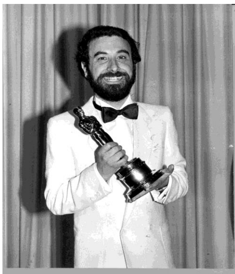
Fig. 3. José Luis Garci con su Óscar, 1982

Grandes logros fueron Volver a empezar (1982) de José Luis Garci, que se alzó con el Óscar a mejor película extranjera [Fig. 3], o Los Santos Inocentes (1984) adaptada por el director Mario Camus.