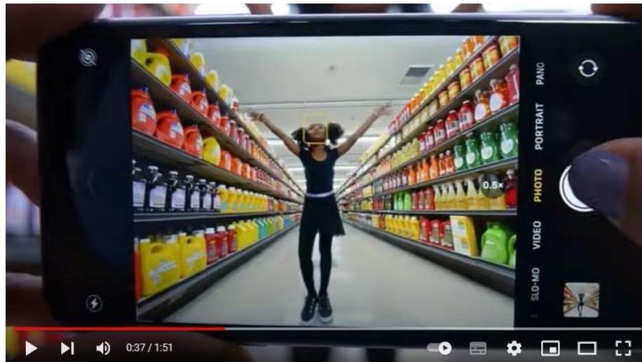
Ilustración 1. Anuncio iPhone 11