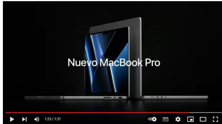
Ilustración 2. Anuncio MacBook Pro