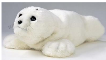
Figura 5. Mascotas artificiales: foca Nuka y perros y gatos.