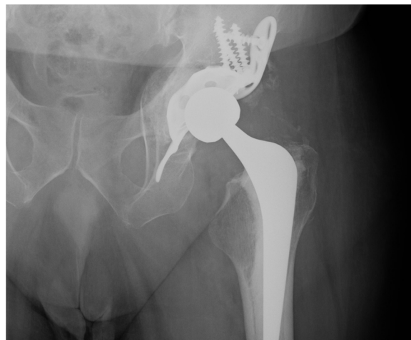
Figura 3 Incorporación de injertos autólogos a los 6 meses de seguimiento.

En la evaluación radiológica se produjo consolidación de la fractura en todos los pacientes y no se observaron complicaciones como rotura de tornillos, movilizaciones de implantes, ni mala posición del componente acetabular. Todos los pacientes presentaban una osteointegración de tipo Gie de grado 3 (fig. 3), 3 pacientes presentaron calcificaciones heterotópicas de grado I según la clasificación de Brooker, uno de grado II y uno de grado III, que en ningún caso han supuesto una limitación funcional.