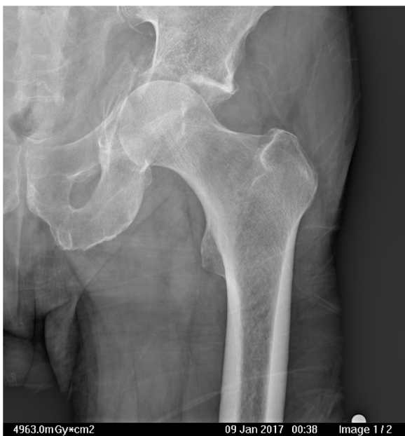
Figura 2 Fractura con protrusión medial de la cabeza femoral, hundimiento del techo acetabular, fractura de la lámina cuadrilátera y pared anterior.

lización de los pacientes desde que se produjo el ingreso hasta el alta hospitalaria fue de 21,5 días (10-87).