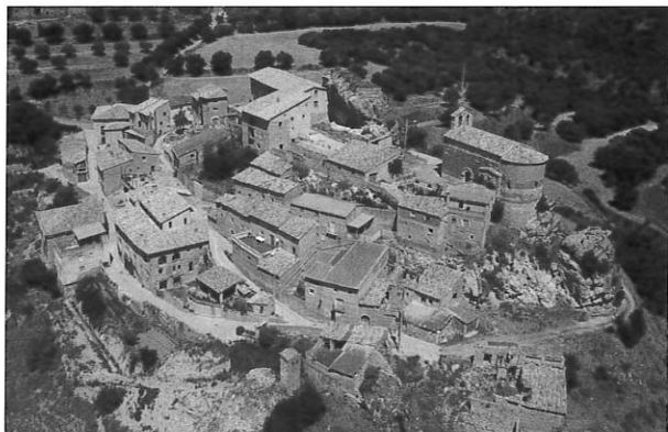
FIGURA 3: Vista general de Alins del Monte

• EL CONGUSTRO, UBAGA DEL CONGUSTRO, BARRANCO DEL CONGUSTRO Doc.: Congustro (1862, 14v, 21v, 32r; 1925; 1965), Barranco el Congustro (1965).