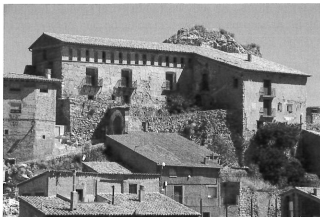
FIGURA 5: Casa Guilleuma (SIPCA)

Azanuy y Calasanz (Giralt, 2005). Fuera del ámbito lingüístico del aragonés, cf. los topónimos Vinyer en Sopeira y Solsona, y Vinyero en Olocau del Rey, al oeste de Morella (OnCat VIII, 77b).