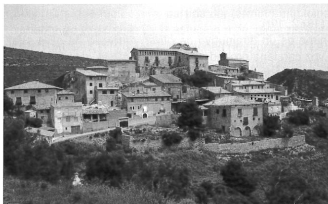
FIGURA 4: Alins del Monte

Voz característica del catalán y del aragonés, que se ha empleado con significados diversos: 'columna o pilar suelto especialmente con una inscripción que recuerda un hecho memorable' o bien 'hito en un camino ganadero, en la separación de dos términos municipales' (DIEC, s.v.); 'pilar de piedra colocado en la orilla de un camino con alguna imagen sagrada'