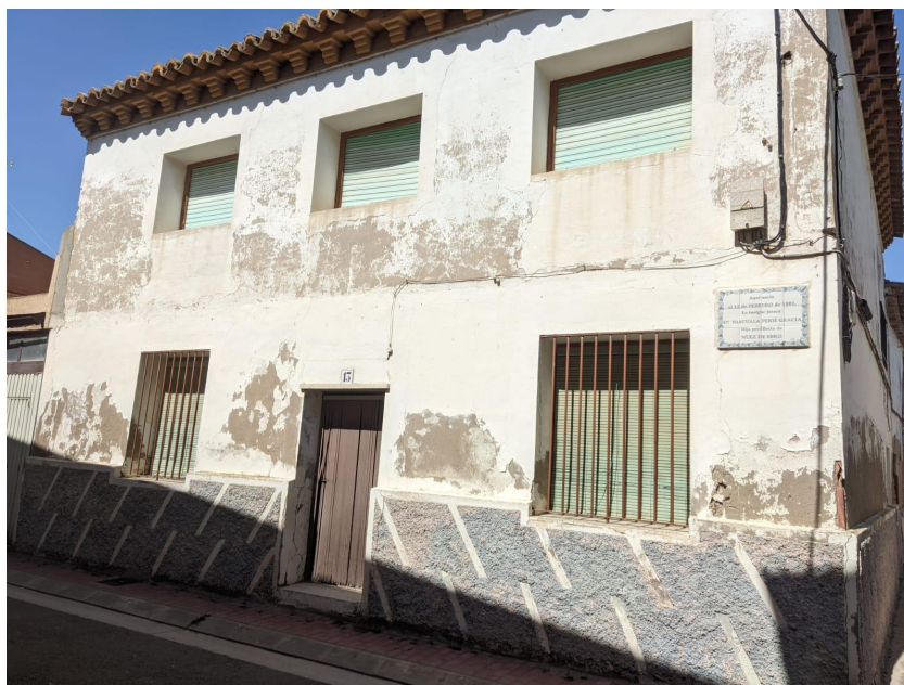
Fotografía 4: fotografía de elaboración propia realizada en la casa de Pascuala Perié.