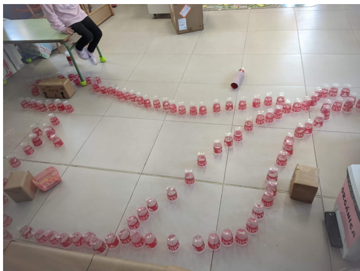
Fotografía 9: fotografía de elaboración propia realizada en el colegio de Nuez de Ebro.