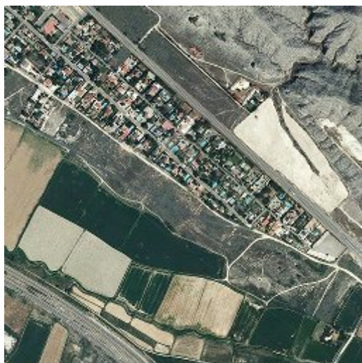
Fotografía 2: ( Mapa satélite de Nuez de Ebro en Zaragoza, 48a. C. )

En las siguientes imágenes se puede observar distintos monumentos de la localidad, de los cuales se han realizado actividades.