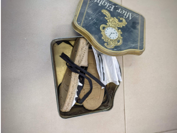
Fotografía 5: fotografía de elaboración propia realizada en el colegio de Nuez de Ebro.