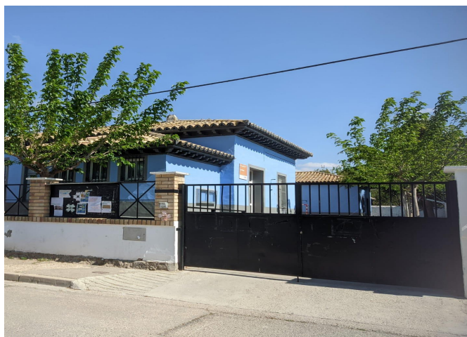
Fotografía 1: fotografía de elaboración propia realizada en el colegio de Nuez de Ebro. CRA La Sabina-Nuez de Ebro.