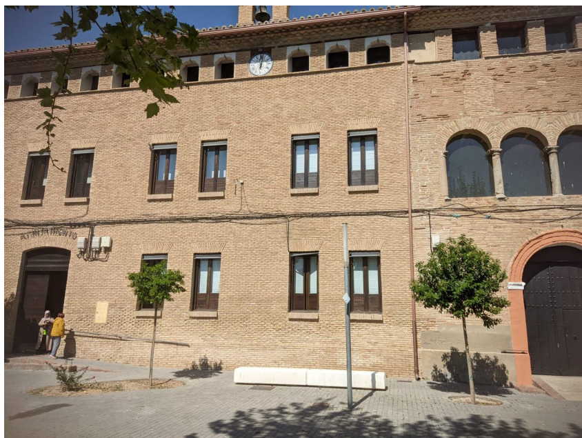
Fotografía 3: fotografía de elaboración propia realizada en el ayuntamiento de Nuez de Ebro.