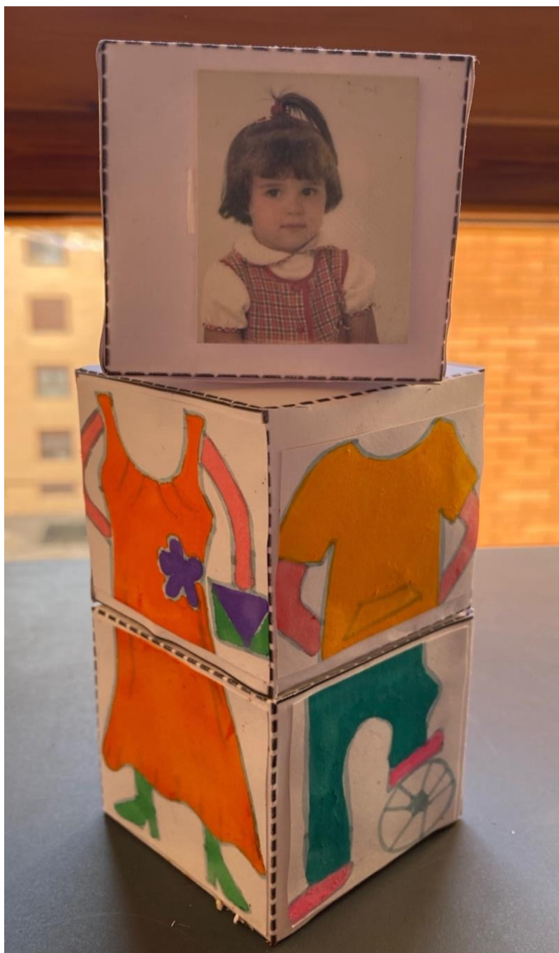
Imagen de la actividad nº3 – Mezcla y combina los bloques