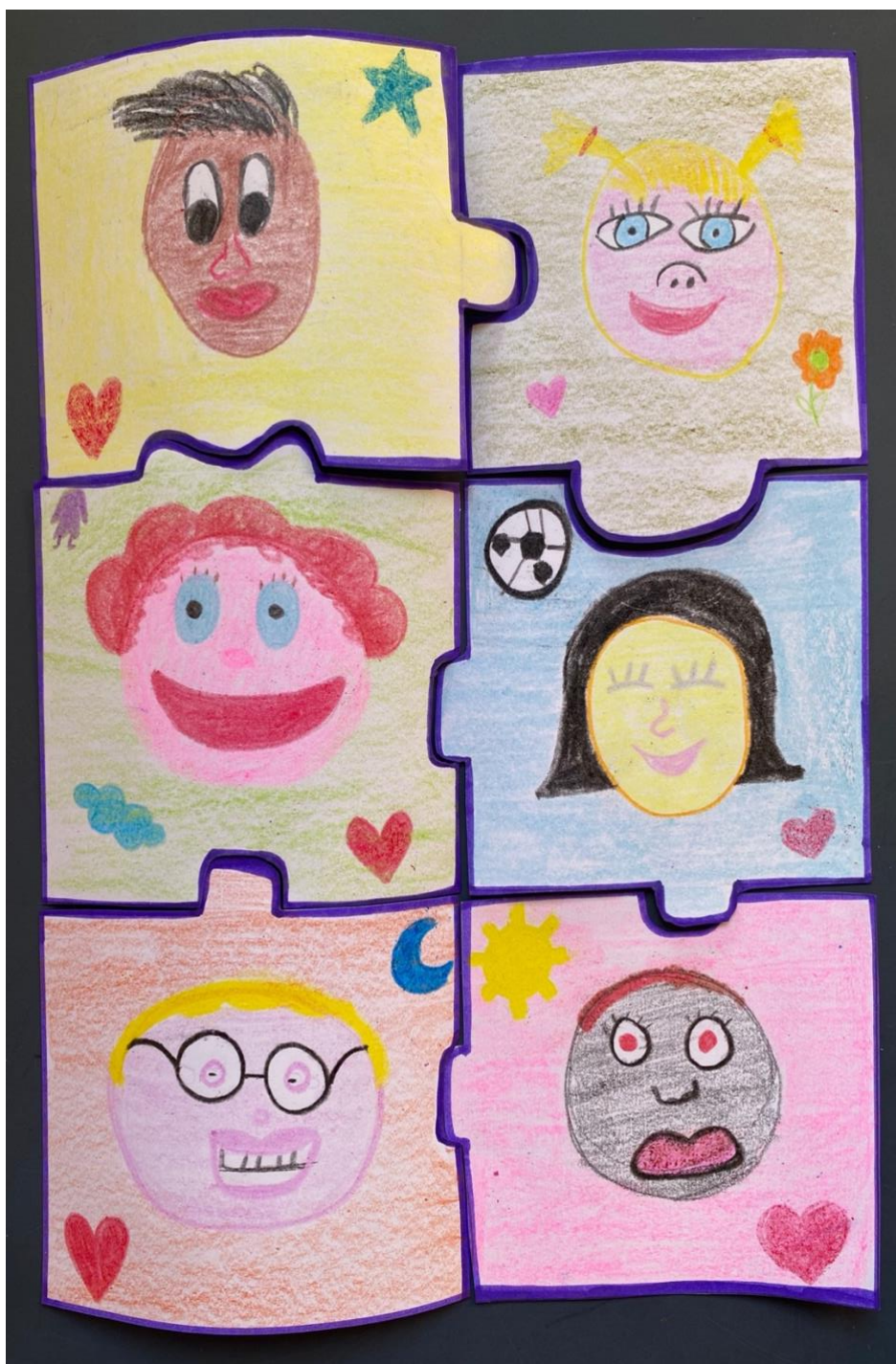
Imagen de la actividad nº9 – Puzle somos esenciales