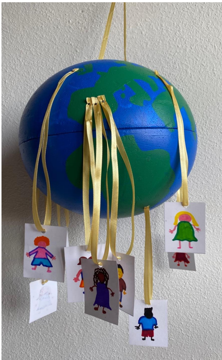
Imagen de la actividad nº12– Todos somos de La Tierra y es de todos