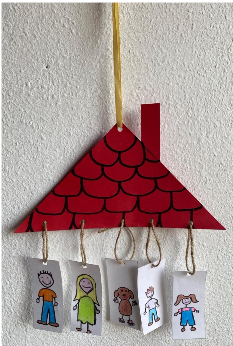
Imagen de la actividad nº15 – Mi familia