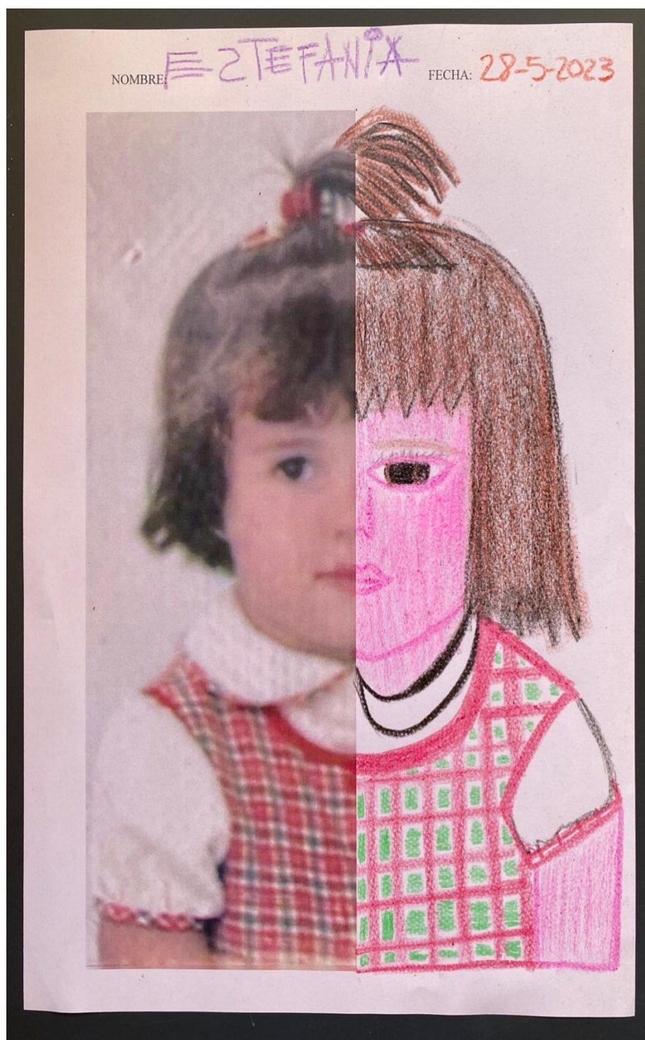
Imagen de la actividad nº6 – Así soy yo