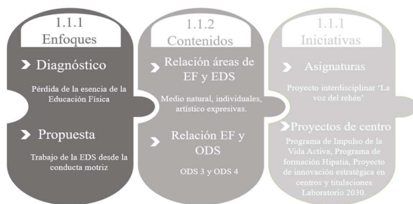
Figura 2. Enfoque transformador.

El indicador 1.1.1. Enfoques generales de la Educación Física, situado en primer lugar con el mayor número de referencias –33 referencias, 50% de la categoría–.