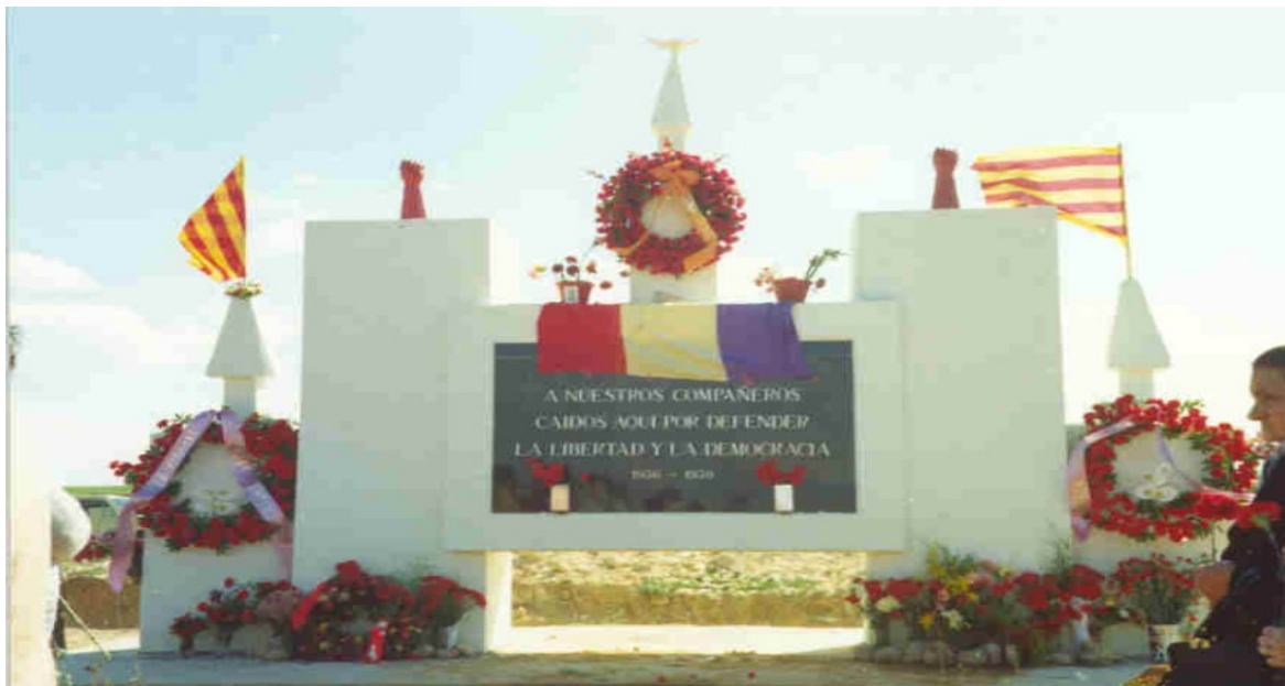
Ilustración 4: Inauguración del monolito Pozos de Caudé, 1 mayo 1980.

En la documentación facilitada por la Asociación Pozos de Caudé encontramos algunas fotografías que nos mostrarán el resultado de este esfuerzo 104 .