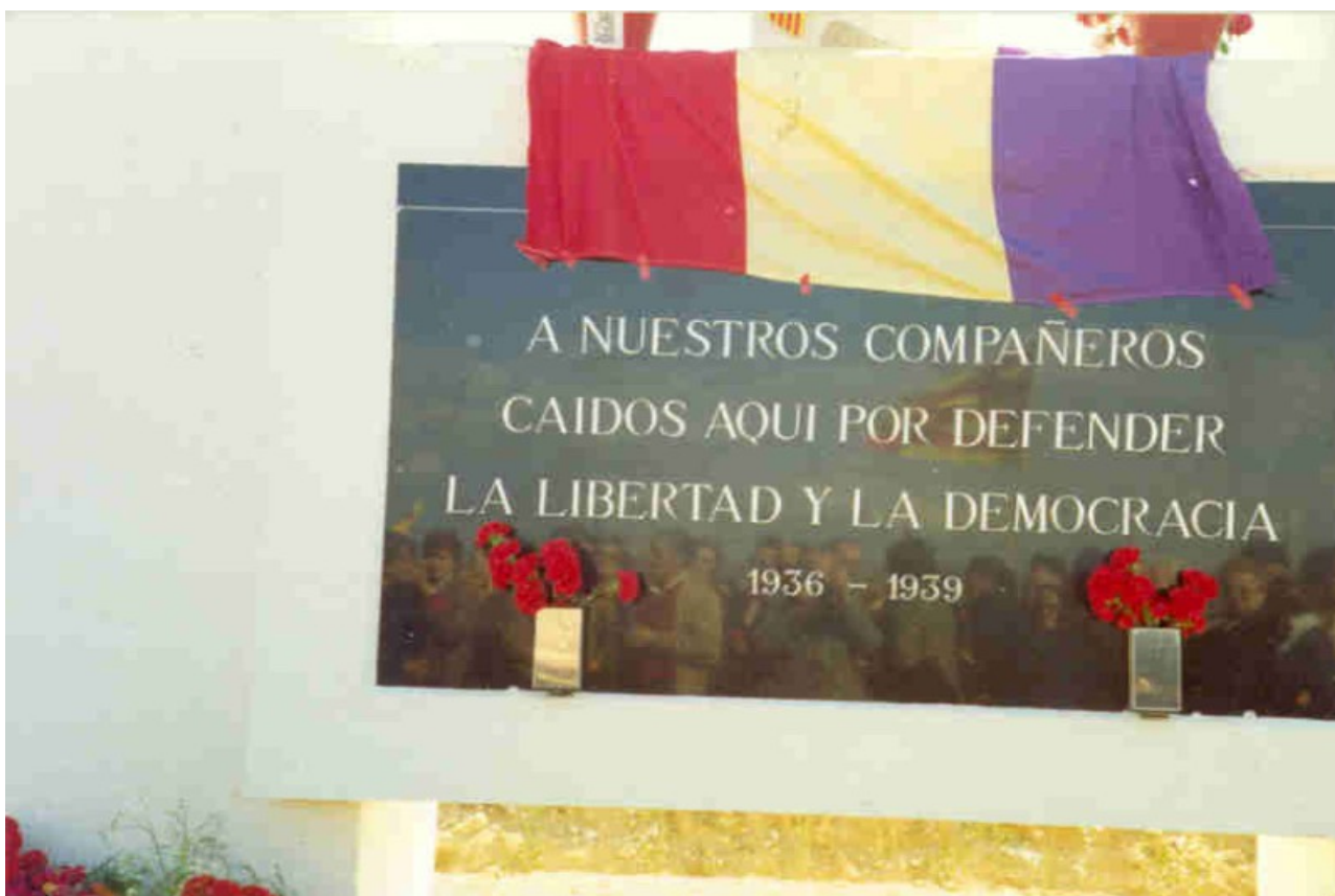
Ilustración 6: Mensaje lápida central 1 mayo 1980

Debemos indicar que este mensaje no gustó a todo el mundo, muchos eran partidarios de cambiar el término aséptico de caídos , por el de fusilados . En su momento se decidió utilizar un término que no provocase demasiado a los ultras: