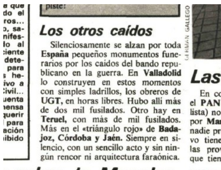
Ilustración 14: "Los otros caídos". Interviú, 17-25 abril 1980 p. 104.