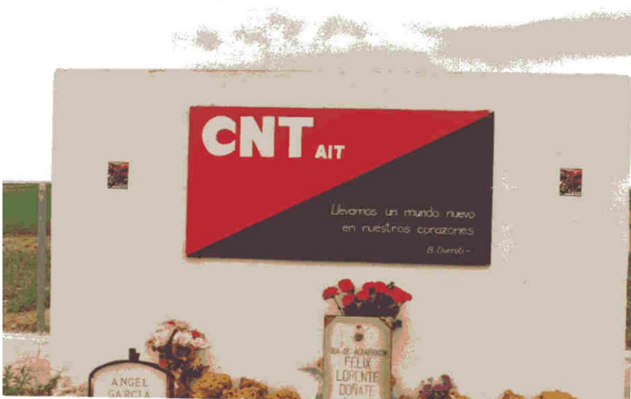
Ilustración 9: Mensaje CNT: "Llevamos un mundo nuevo en nuestros corazones" B. Durruti.