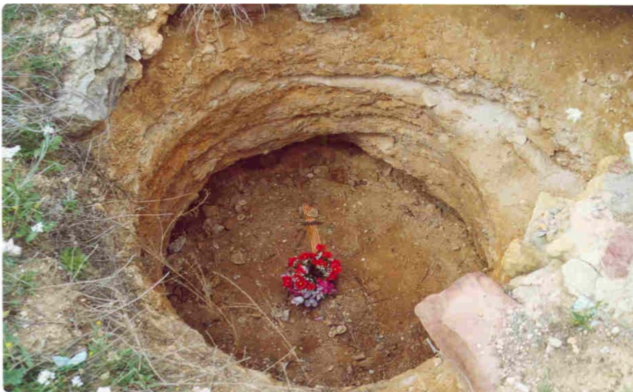
Ilustración 8: Vista del pozo antes del recubrimiento.