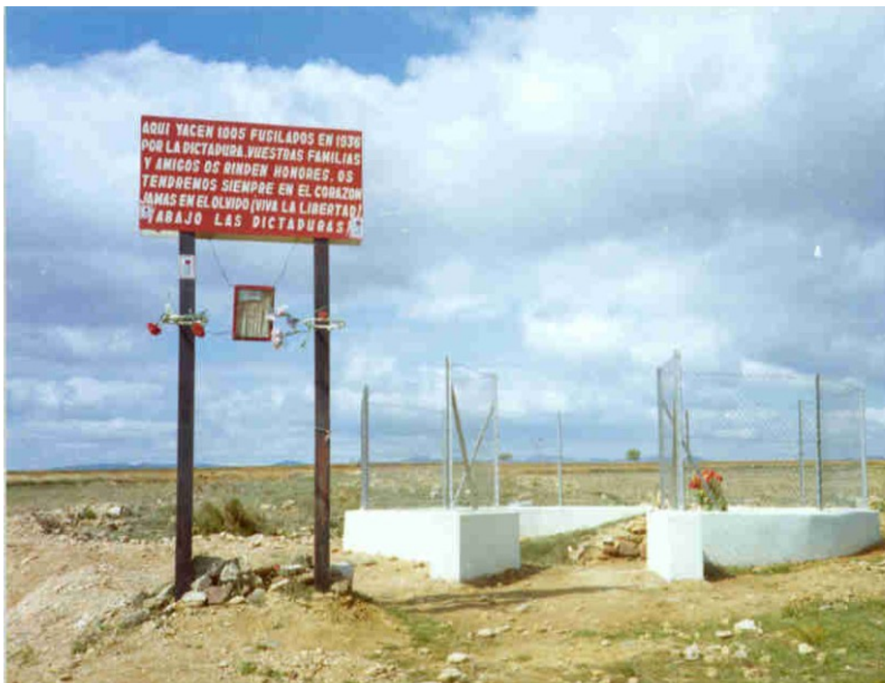
Ilustración 7

En la siguiente serie de fotografías vamos a ver una foto del pozo antes de ser cubierto por un cristal por el proyecto PLATEA, en 2007. Observaremos también el cercado que se realizó en torno al pozo y el primer panel que se erigió en el lugar, antes de iniciar la construcción del monolito, que se encuentra justo al lado.