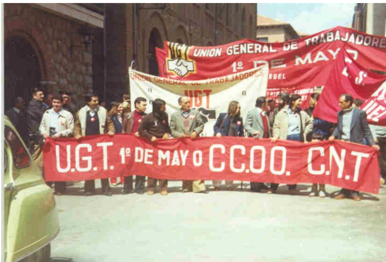
Ilustración 13: Primera celebración del 1º de mayo en Teruel. Llama la atención la unidad sindical de estos primeros años demostrada en esta fotografía, compartiendo la cabecera de la manifestación CCOO UGT y CNT.