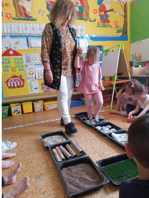
Imagen 2: Imagen de una niña realizando el taller sensorial relacionado con el tacto. La niña mostraba curiosidad por el papel de lija, puesto que era un tacto novedoso para ella.