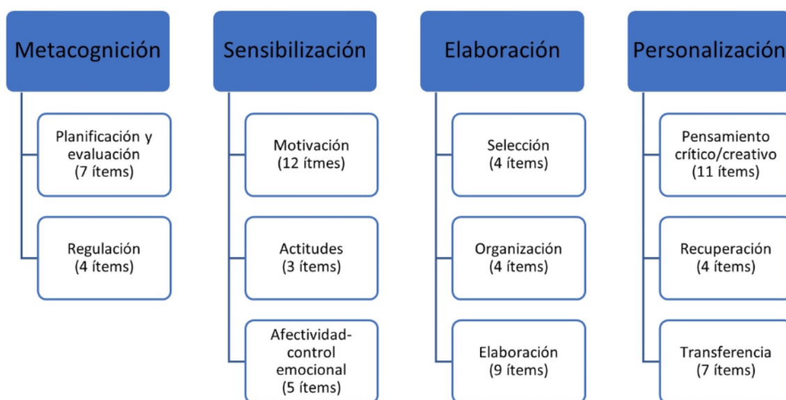
Figura 1. Escalas del Cuestionario de Estrategias de Aprendizaje (CEA)

casi nunca (2), a menudo (3), casi siempre (4) y siempre (5). Para dar respuesta a todos los ítems, se plantean situaciones como: a) preparo los exámenes a conciencia o me encuentro plenamente integrado en mi propio grupo de clase para analizar el proceso de sensibilización, b) cuando estudio, me doy cuenta de lo que es más importante y lo que es menos importante o en la clase tomo notas para recordar la información esencial para estudiar el proceso de elaboración, c) me esfuerzo por ver las cosas de manera diferente a como las ven los demás o utilizo los conocimientos o principios adquiridos en una lección de una determinada materia en otras lecciones de la misma materia para el proceso de personalización y d) evalúo los resultados obtenidos en el aprendizaje o una vez que me pongo a estudiar voy realizando las tareas señaladas sin preguntarme si las voy comprendiendo o no para entender el proceso de metacognición.