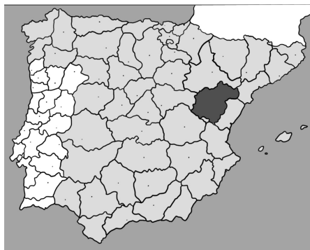
FIGURA 1 | Localización de la provincia de Teruel y comarcas que la integran