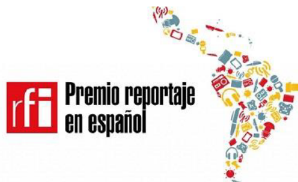
Figura 8. Logotipo del Premio Reportaje en español que entrega RFI

La apuesta de RFI Internacional por el periodismo de calidad, la sinergia entre talento francés e hispanoamericano queda patente en la entrega del premio "Reportaje RFI en español" (Ilustración 8) que en 2019 celebró su quinta edición. Un galardón destinado a estudiantes de periodismo menores de 30 años, residentes en América Latina y el Caribe. Para participar, los estudiantes deben enviar un reportaje radiofónico de una duración máxima de 13 minutos, así como una propuesta de reportaje para realizar en París, que finalmente podrá realizarse durante los cuatro meses de estancia totalmente pagada que obtiene el ganador del certamen.