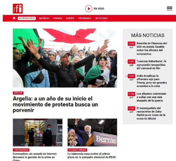
Figura 1. Portal web de RFI en español

Radio France Internacional arrancó en 1998 su página web específica de contenidos en español. El enlace es una derivación de la página web oficial, de ahí la relevancia que tiene para Radio France la presencia en español. http://www.rfi.fr/es/