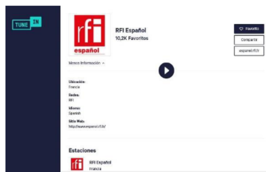
Figura 4. Perfil oficial de RFI español en la app de streaming radiofónico

Además, las redes sociales y la emisión a través de YouTube y de Tune In tienen una fuerte presencia en la portada. Radio Francia Internacional posee perfiles en medios sociales específicos para su emisora en español y ofrece al oyente la posibilidad de escuchar sus programas en directo y en diferido no solo en la página web sino a través de dispositivos móviles o altavoces inteligentes mediante la aplicación Tune In, donde la emisora ya tiene más de 10 mil seguidores. Tune In es ya una de las principales apps para escuchar radio en streaming en todo el mundo.