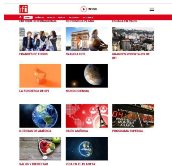
Figura 6. Repositorio de programas de RFI en español