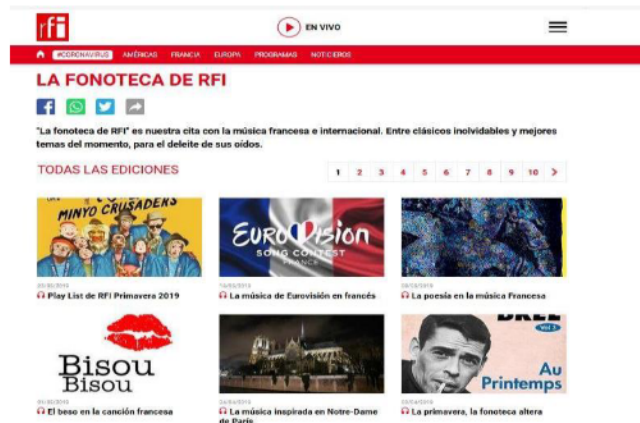
Figura 7. Espacios musicales del programa "La fonoteca de RFI"