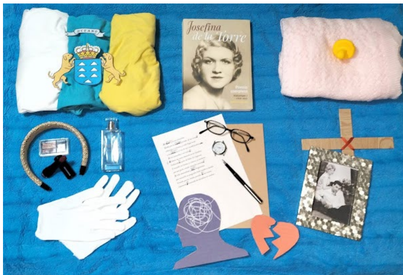
Figura 5. Acróstico Rafael Alberti. GR02 INVTICUA22 https://constelacionesgeneracion27.blogspot.com/2022/06/4creaciones-literarias.html