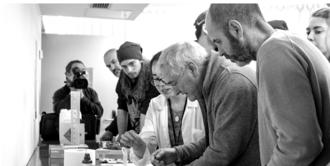
Figura 2. Estudiantes de Bellas Artes y neurocientíficos del Instituto de Neurociencias de Castilla y León, en el Taller de color, tejidos y peces . Laboratorios INCYL. 2023.