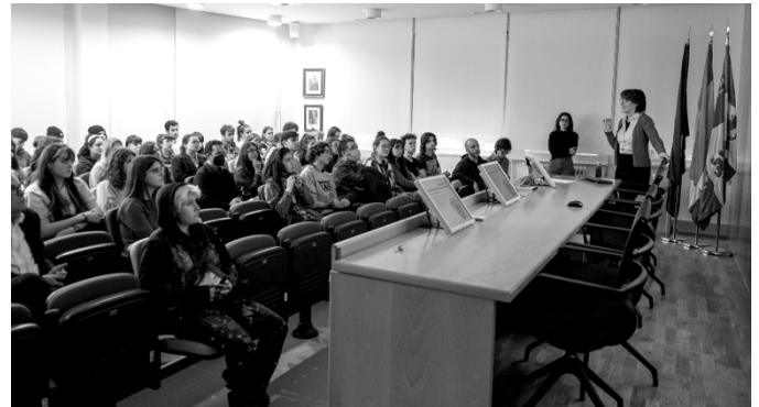
Figura 1. Seminario Aula Abierta , con el GIR Gis, Memoria y Cognición , Salón de grados, Facultad de Psicología, USAL, 2023.

21/02/2023. Seminario Aula Abierta. Presentación de resultados de investigación sobre la relación entre creatividad artística y cognición . GIR Gis, Memoria y Cognición . Los estudiantes de Bellas Artes formaron parte de este estudio comparativo en el que se analizaban, mediante pruebas científicas, las diferencias entre la memoria, habilidad espacial y capacidad perceptiva del cerebro de artistas y no artistas. El resultado sólo arrojó diferencias en las habilidades espaciales de las mentes artísticas, capacidad que se ejercita durante la formación de los estudiantes de Bellas Artes.