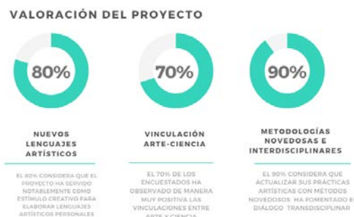
Figura 5. Gráfica encuestas anónimas de valoración del proyecto.

Además de la muestra colectiva Imagen Artística / Imagen Científica. Experiencias creativas en torno a la relación arte – ciencia , en cuyo proceso creativo participaron exclusivamente los estudiantes, el proyecto también ha sido evaluado por ellos mismos de manera anónima a través de una encuesta de resultados y cuyas valoraciones han sido muy positivas.