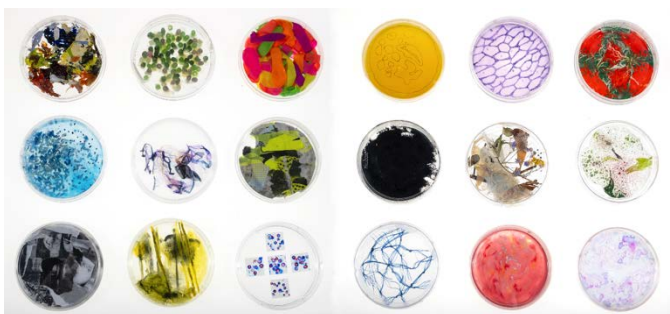
Figura 3. Placas de Petri intervenidas por estudiantes de Grado y Máster con diferentes técnicas artísticas.

La realización de la fase formativa fue el germen para que los estudiantes tomaran consciencia de los nexos comunes existentes entre los procesos creativos y los científicos. Por lo que, tras este periodo de aprendizaje, los estudiantes de Arte pudieron aplicar esos conocimientos adquiridos de la neuroestética y la biología celular, en su práctica artística.