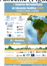
Figura 2.1: CIEDUC 2022. Guatemala

Experiencias educativas en Ciencias, Apropiación social de las ciencias y su contribución a los debates actuales y a la formación ciudadana, Competencias comunicativas en Ciencias, Experiencias STEAM, Ciencias de la Tierra y Educación Ambiental, Educación para la Salud y Profesionalización docente (Figura 2.1).