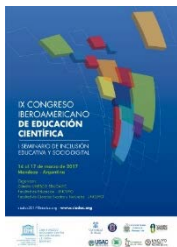
Figura 2.3: CIEDUC 2017. Argentina

permanente y formación avanzada. Pedagogía y Didáctica de las Ciencias Experimentales, de las Matemáticas y de las Ingenierías. Currículo CTS (Ciencia, Tecnología y Sociedad), Educación para la Salud y Ambiental. Integración curricular de las TIC a la enseñanza y aprendizaje. Gestión y evaluación de proyectos educativos institucionales. Apropiación social y aprendizaje de las Ciencias en ambientes educativos no formales. Investigación e innovación en educación e Inclusión Educativa y socio-digital (Figura 2.3).