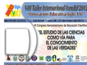
Figura 2.5: CIEDUC 2013. Cuba