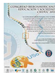
Figura 2.6: CIEDUC 2011. Chile