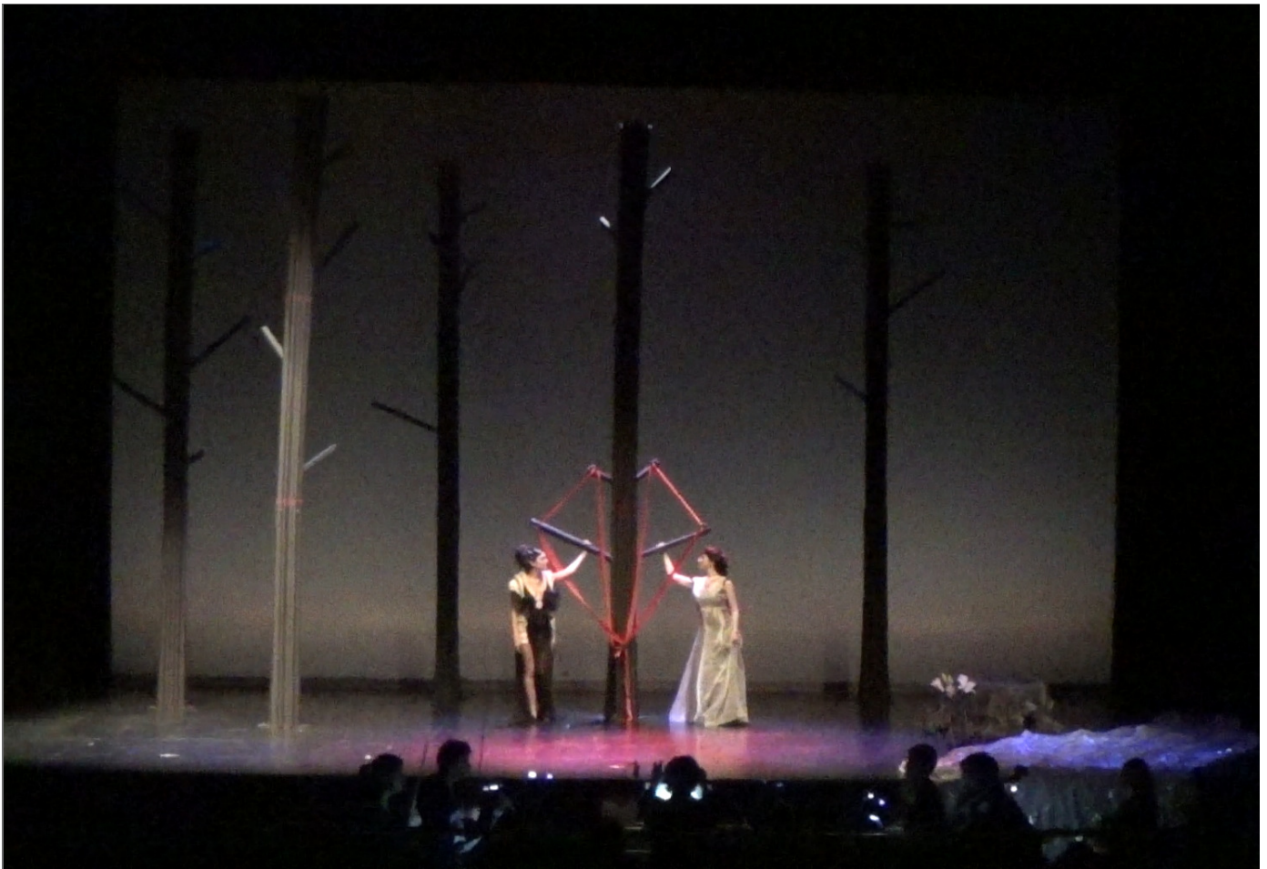
Figura 3. La ninfa e il pastore de Antonio Vivaldi, 2015.