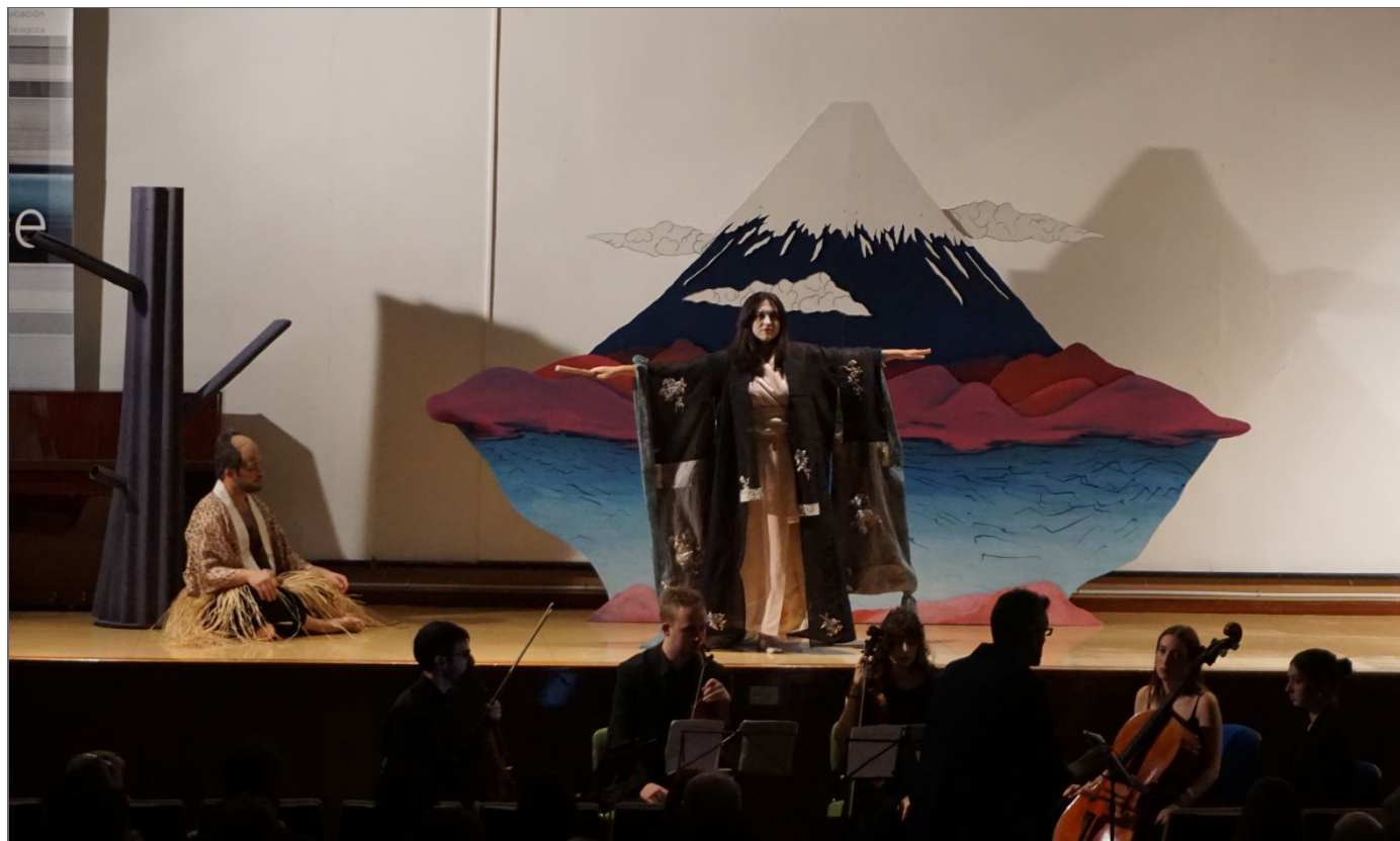
Figura 5. Hagoromo de Komatsu Kōsuke, 2023.

contrapunto a esa aproximación a lo tradicional mediante los elementos escénicos, Urdániz buscó, mediante el vestuario, acercamiento teatral más moderno y cercano a la realidad de los espectadores de lo que fue el estreno de 1903. Hakuryō vestido como un humilde pescador tradicional japonés. El coro, con haori azul oscuro sobre camiseta blanca, evoca las c del mar, de donde surge la tennyo . Ella viste en ese momento un kimono de color salmón claro, evocando su desnude pureza que cubrirá posteriormente con el hagoromo , creación realizada ex proceso para el espectáculo basado en un g kimono vaporoso de color negro y decoraciones en turquesa de gran tamaño.