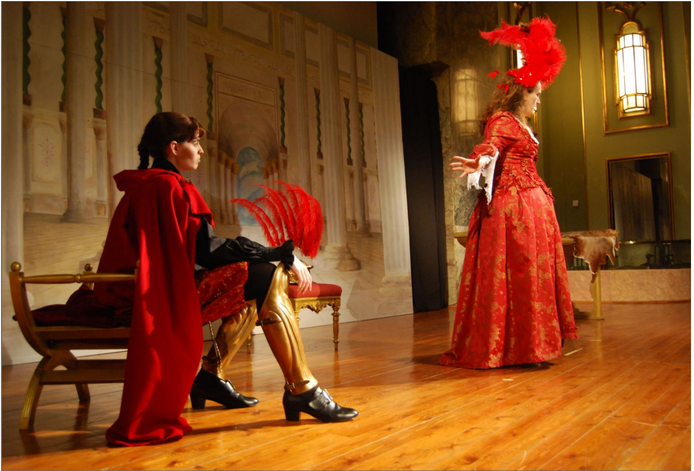
Figura 1. Antonio e Cleopatra de J. A. Hasse, 2012.