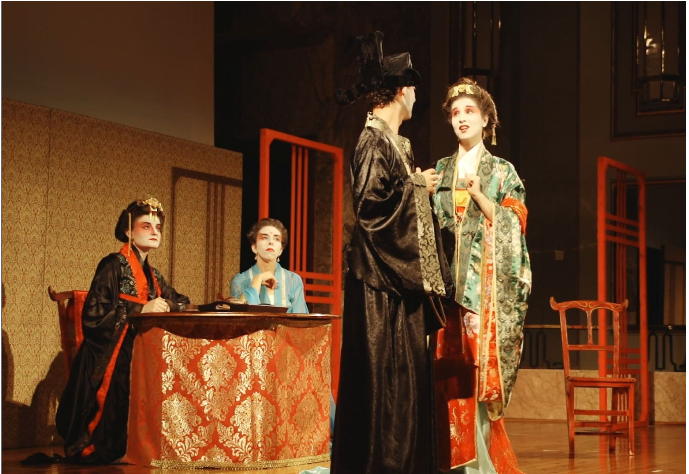
Figura 2. Le Cinesi de Cristoph Willibald Gluck, 2014.