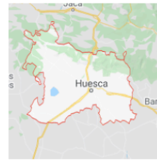
Hoya de Huesca