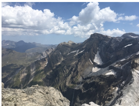
Ilustración 2. Pico de Marboré desde el Casco de Marboré.

El Decreto Legislativo 1/2015, de 29 de julio es en el que se aprueba el texto refundido de la Ley de Espacios Protegidos de Aragón (LEPA), que recoge las normativas de los espacios naturales protegidos en Aragón. No obstante, es imprescindible recurrir al Plan Rector de Uso y Gestión (PRUG) en caso de no conocer si alguna actividad está prohibida en un determinado espacio.