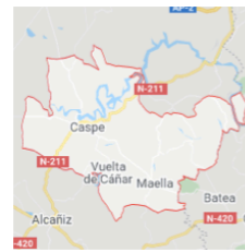
Bajo Aragón / Caspe