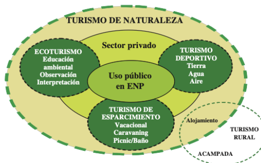
Ilustración 1. Turismo de naturaleza.