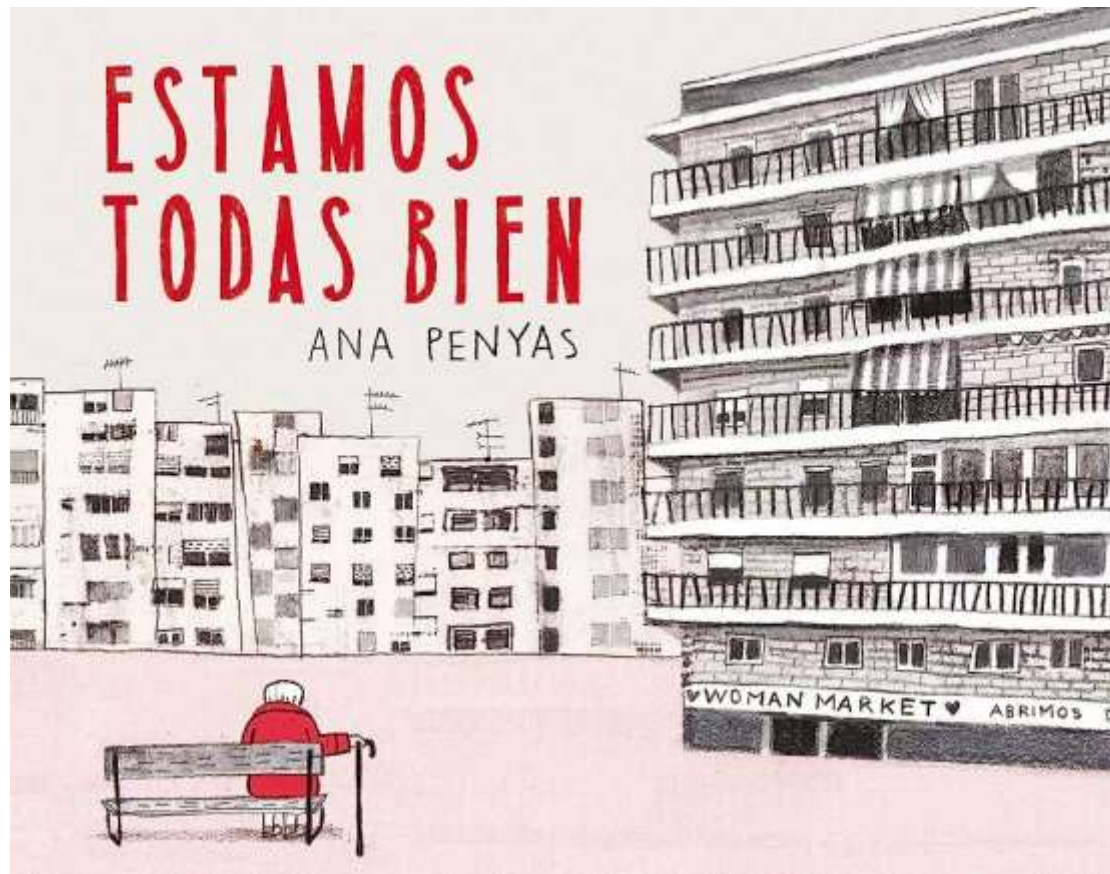
Fig. 1. Portada de Ana Penyas, Estamos todas bien , Barcelona, Salamandra, 2017.

Estamos todas bien , guionizado y dibujado por Ana Penyas recibió el galardón en 2017 y fue acreedor del Premio Nacional de Cómic al año siguiente, convirtiéndose así en la primera mujer en obtenerlo. La historia se constituye como un ejercicio de memoria y de reivindicación de la mujer, tomando como protagonistas a las dos abuelas de la autora [fig. 1]. En el año 2022 (en que llegó a su edición número dieciséis) el galardón supone una única dotación económica de 10.000 euros para el desarrollo del proyecto ganador, así como la edición del libro por parte de Salamandra Graphic y su distribución en los establecimientos FNAC (FNAC, 2022)[5]. Su última premiada fue Marina Velasco por ¡Que no se nos olvide! , mirada necesaria sobre la conquista de los derechos LGTBIQ+ a través de seis entrevistas con personas reales.