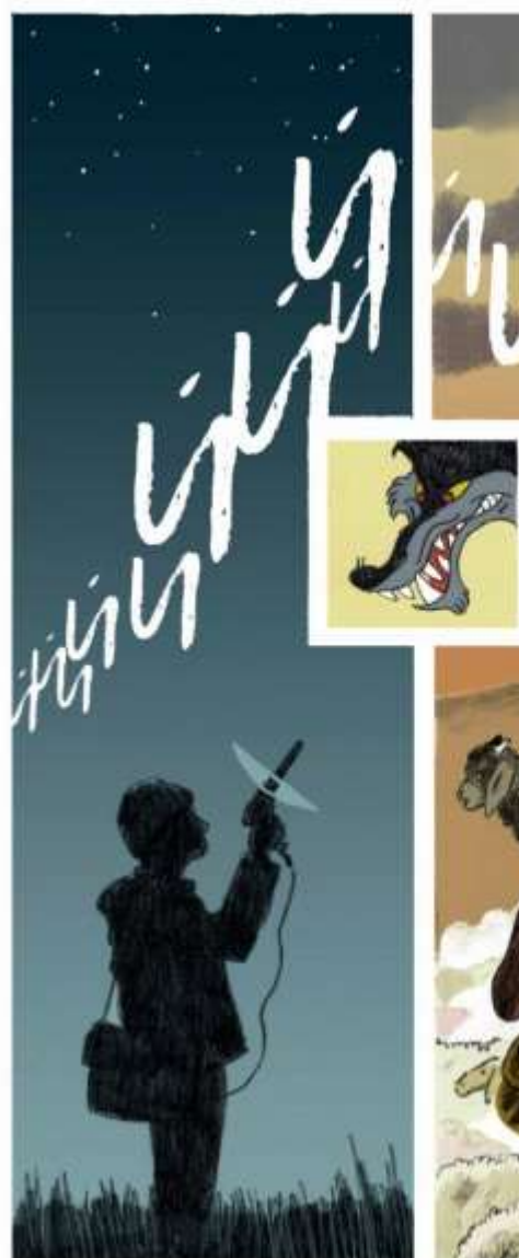
Figs. 6 y 7. Páginas de los proyectos de María Perera ( Marga ) y Mario Trigo ( La espera ).

Además, fueron considerados para su mención el proyecto Éxtasis místico de Emilio Rolandi (Buenos Aires, 1987) y Abuela de Bruno Hidalgo (San Sebastián, 1982). La primera es una propuesta que experimenta con los recursos del diseño gráfico para definir la biografía del piloto brasileño de automovilismo Ayrton Senna [fig. 8]. Hidalgo toma como material de trabajo su propia historia familiar, a través de la vida de su bisabuela, habitante de una aldea gallega situada en la costa del Atlántico, atada a la tierra, sus tradiciones y a una realidad, en cierta manera mágica o atávica [fig. 9].