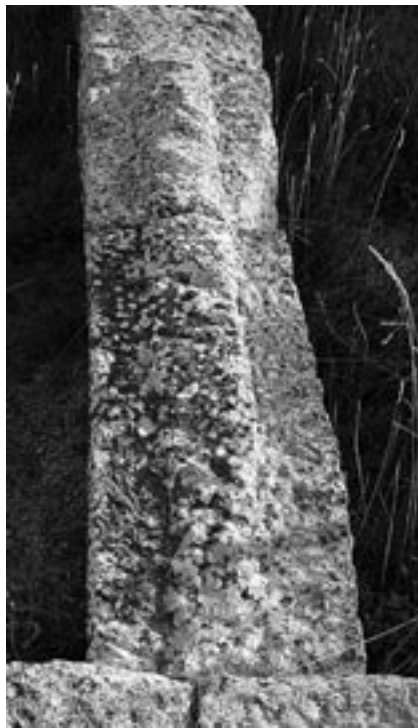
FIG. 4. Muesca central de los sillares en la Casa del Peristilo de Los Bañales.

La existencia de 11 columnas la planteamos debido a que en la crujía sur no aparece una de las marcas con dos orificios para colocar las columnas. Quizás, la irrupción en el ritmo del peristilo pudo coincidir con la entrada o acceso a la vivienda. La irregularidad del intercolumnio no debe sorprender debido a que es algo habitual según exigencias arquitectónicas o bien cuando se puede hacer coincidir el ritmo del peristilo con los accesos a las estancias, tal y como se observa en la Casa A de Atenas 18 .