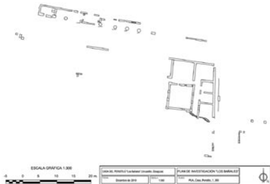
FIG. 6. Planimetría de los restos actualmente conservados de la Casa del Peristilo.

En este sentido podemos definir la vivienda como una residencia de peristilo con forma cuadrada 22 , tipología muy difundida en la región del África Proconsular 23 o en la Grecia romana 24 con una extensión del espacio abierto que alcanzaría los 6,3 x 6,4 m. Esta zona central abierta se convierte en el elemento vertebrador de los espacios, así como en el módulo arquitectónico de la vivienda (obsérvese en la Fig. 6 las proporciones similares existentes entre el lado del peristilo y la longitud de la estancia central).