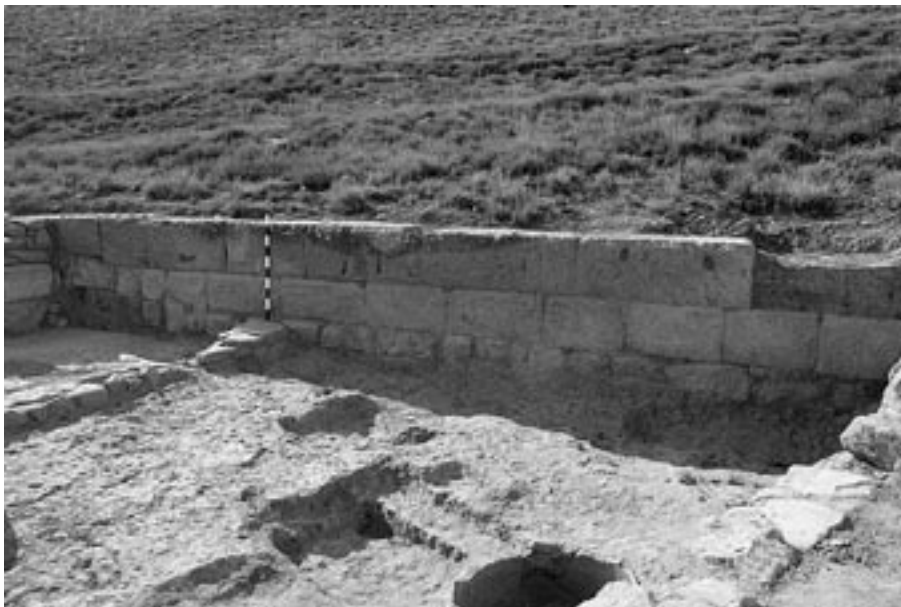
FIG. 7. Espacio 1 del área junto a las termas excavada en la campaña de 2009.

pia de la vivienda y de posibles reparaciones. De todas las estructuras llama la atención un muro de sillares muy bien ajustados que se conserva con tres hiladas de altura, 1,30 m, y una longitud de 9,30 m. Sirve de muro de fondo a los Espacios 1 y 5 de la vivienda. Claramente se trata del muro de un edificio previo, muy posiblemente de uno de tipo público dada su calidad y que se asemeja a las estructuras que se pueden ver en otro edificio en lo alto de El Pueyo o en el denominado templo por J. Galiay 44 .