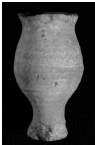
FIG. 11. Ungüentario en cerámica común romana recuperado en el espacio ubicado junto a las termas, en 2009.

La zona calcinada se sitúa en un recuadro de la zona central, dejando un pasillo alrededor aunque no hay ninguna estructura que levante por encima del suelo. Sí que existen huecos con restos de tierra calcinada a modo de hornos o fogones y huellas de donde pudo haber jarras o tinajillas enterradas hasta la mitad. Junto a la pared de cierre de la vivienda en su lado más oriental se encontró un dolium