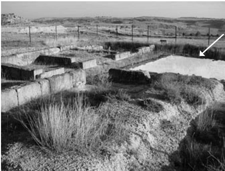
FIG. 5. Zona del peristilo con el espacio descubierto sombreado (Foto: P. Uribe).

Gracias a estos pretilos o balaustradas, que podían estar realizados en piedra o en madera, ubicados en medio de los intercolumnios, el área descubierta quedaba cerrada, accesible a través de diferentes vanos que solían coincidir con los ambientes de representación. La decisión de cerrar los intercolumnios fue un elemento muy característico de las viviendas del África Proconsular ( Volubilis , Cuicul , Tipasa o Cesarea ) datadas entre los siglos II y III d. C. 19 . También se documentan paralelos en las casas pompeyanas de la Casa del Menandro 20 con un muro interior pintado con la representación de un jardín, en el Forno di Proculus, en la Case di Cornelio Rufo, o en la Case del Centenario 21 .