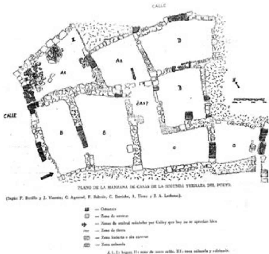
FIG. 3. Viviendas de El Pueyo (según Beltrán Lloris, F.: 1977).

apartado de casas con tipología indeterminada que responden sobre todo al medio físico en el que se ubicaron.