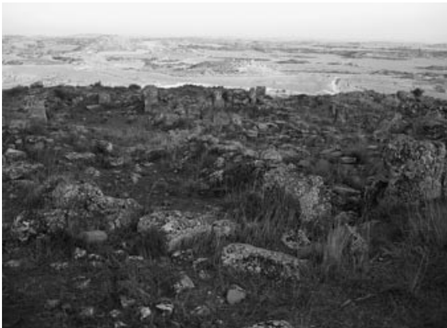
FIG. 2. Muros de las casas de El Pueyo con los ortostatos al fondo.

mente enlosada que partía de las cercanías del templo y daba acceso a la primera terraza, lugar en que las casas adoptaban una distribución radial. En la segunda terraza las casas se dispusieron en manzanas con calles perpendiculares que se cruzaban en ángulo recto (Fig. 3).