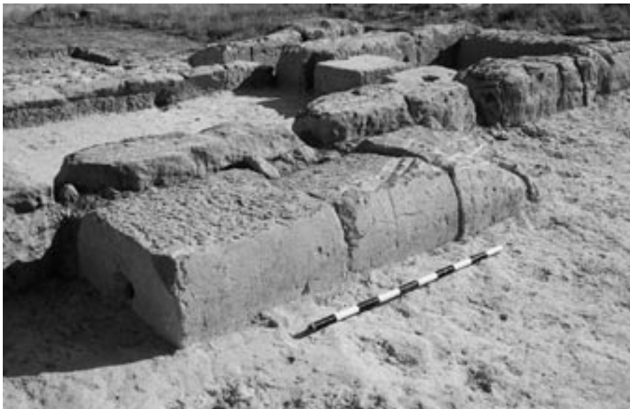
FIG. 12. Monumental columna retallada descubierta en la estancia principal del espacio excavado en 2009.

enterrado que sobresaldría originalmente del suelo desde la altura de sus asas. La boca, rota, se encontró en la excavación de su interior, así como fragmentos de otras cerámicas.