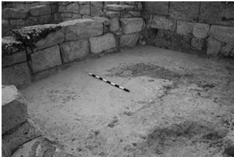
FIG. 8. Pavimento de terrazo blanco en el Espacio 1.

Tampoco los restos de pintura que había sobre el muro de sillares pertenecen a esta fase de la vivienda, pues el muro que separa los Espacios 1 y 2 se adosa sobre estas pinturas. Las pinturas siguen motivos bastante convencionales como son los zócalos moteados sobre fondo negro. Aunque no se puede emplear dicho material como criterio cronológico ante la ausencia de un estudio profundo de los repertorios pictóricos del yacimiento que nos permitiese establecer criterios cronológicos exactos, en la Galia 45 y en la Península Ibérica 46 conocemos que la factura de estos zócalos moteados sobre fondo negro se podría datar durante la primera mitad del I d. C., existiendo un cambio de decoración a partir del año 50 en que estos zócalos moteados pasan a realizarse sobre fondos fundamentalmente rosas.