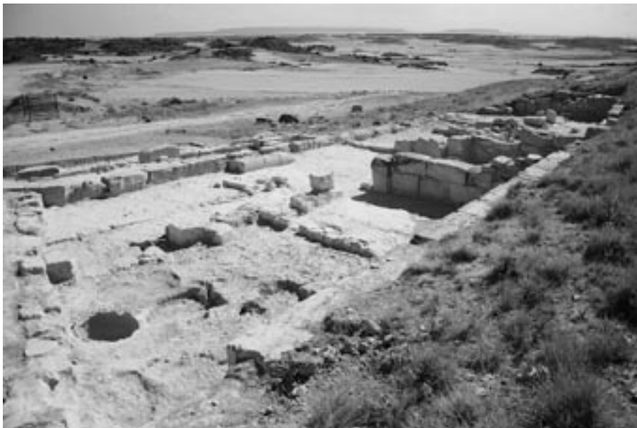
FIG. 14. Panorámica del espacio excavado en 2009.

Los datos aquí presentados —que en gran parte siguen los que ya se dieron a conocer en el informe de memoria de la intervención de 2009 47 — no son más que los resultados preliminares de una zona en fase de estudio cuya investigación no finalizará hasta haber excavado este sector en su totalidad (Fig. 14). Ante estos resultados, por el momento, no somos capaces de vislumbrar si realmente se trataría de una vivienda o de una taberna con espacios habitables. Cabe destacar, ante la presencia de un dolium y la gran cantidad de industria ósea relacionada con la higiene femenina —casualmente frente a unas termas públicas— que P. Kastenmeier 48 en Pompeya expone que nunca se han encontrado grandes contenedores como dolia o cupae dentro de las viviendas. La gran capacidad contenedora de estos recipientes superaba las exigencias de una vivienda y por eso, el descubrimiento de estos grandes contenedores dentro de una residencia evidenciaría una actividad comercial de los propietarios o inquilinos de la vivienda.