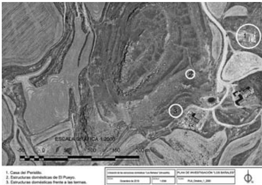
FIG. 1. Ubicación en la ortofoto de las estructuras domésticas dentro del yacimiento de Los Bañales.