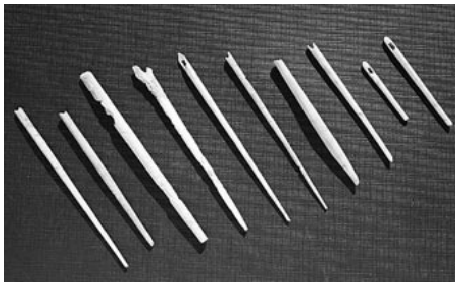
FIG. 13. Lote de agujas de hueso recuperado en la excavación de 2009 en Los Bañales.