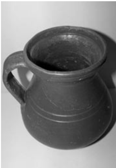
FIG. 9. Jarrita de sigillata hispánica hallada completa en el interior de la sala de estancia del espacio excavado en 2009.