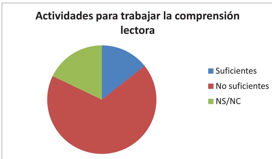
Gráfico 3. Actividades para trabajar la comprensión lectora

Las actividades que más se repiten como respuesta a este interrogante, aquellas que el profesorado considerado como más útiles, son las cuestiones de verdadero o falso, encontrar fallos sobre la lectura, crear otra historia similar cambiando el final o los personajes, representar la lectura, contar el cuento que se ha leído. También “las actividades para familiarizar a los alumnos con distintos tipos de textos, enriquecer el vocabulario, para el desarrollo de la capacidad de expresar ideas, sentimientos, situaciones... tanto oral como de forma escrita”. Por último, las de respuesta múltiple, preguntas cortas, ordenar párrafos, textos de otras asignaturas puesto que se trata de una destreza transversal y las tareas que impliquen una búsqueda de información. No obstante, suelen ser los propios maestros los que elaboran los ejercicios a través de los