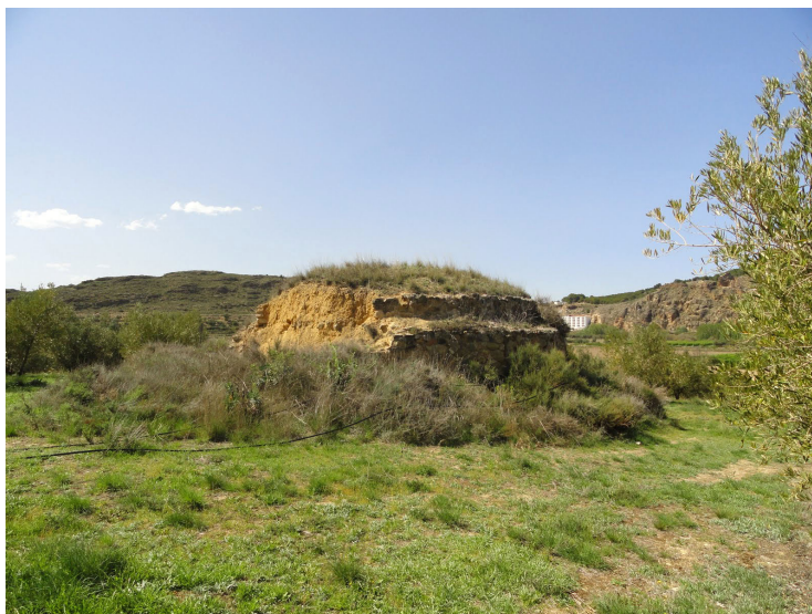
Fig. 2: Elera de Tudején (Navarra), siglo XVII.

El segundo se refiere al propio expolio de los materiales del yacimiento. Podemos constatar cómo Juan Francés de Villalobos se llevó “(...) una Botija de las que avian sacado, la qual venia mostrando a todos los que encontrava