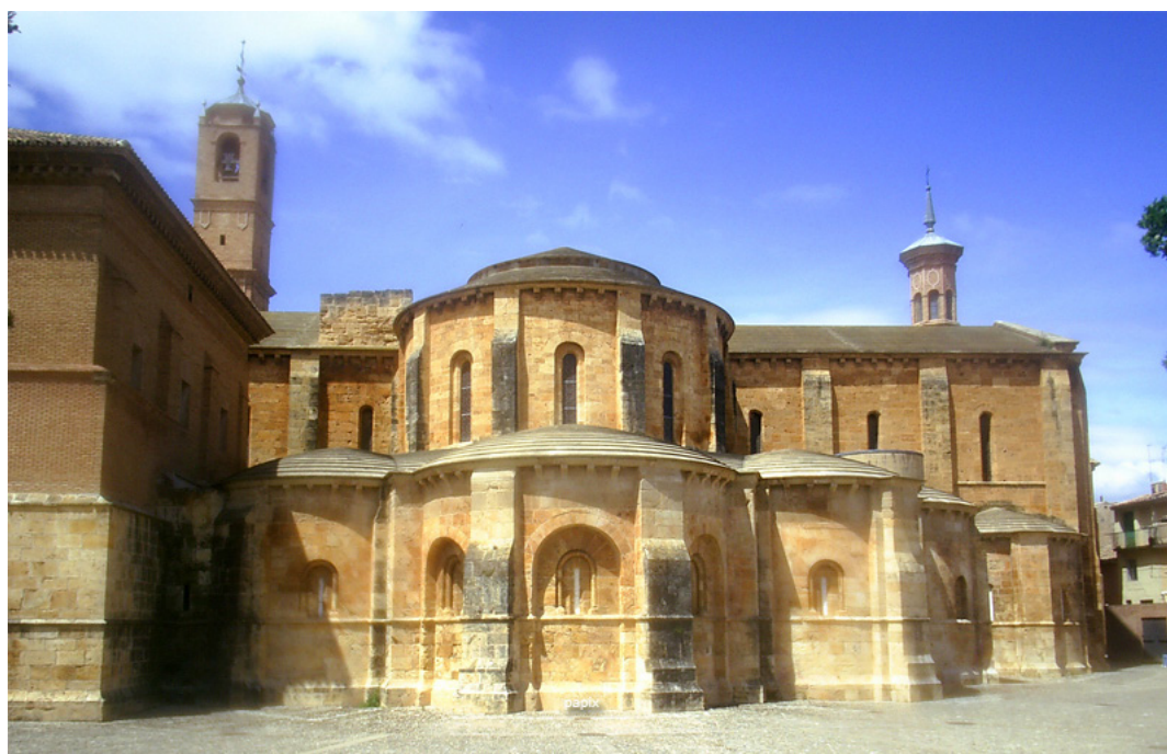
Fig. 3: Absidiolos de la cabecera de la iglesia del monasterio de Santa María la Real de Fitero (Navarra).

y diciendoles la havia de guardar para Memoria”, aunque con total certeza han sido muchísimos más los objetos retirados. ¿Dónde han ido a parar?, ¿qué es de ellos? Las más de las veces, los instrumentos “menos valiosos” debieron perderse o romperse, simplemente han desaparecido. Otros en cambio pudieron ir a manos de anticuarios y coleccionistas de la época 17 . De los que han sido recuperados más