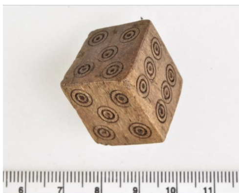
Ilustración 1: Dado trucado de Vågsbunnen (Noruega). Se aprecian dos 5 en sus caras.

Esta noticia, junto con los contenidos vistos en clase sobre los tiempos de trabajo y festivos en las sociedades medievales y la consulta de artículos de investigación acerca de las normativas legales que regulan las actividades lúdicas, o en su caso, prohíben y castigan determinadas prácticas lúdicas en las que el azar interviene, ha motivado mi interés por profundizar en algunos aspectos de los juegos de azar en el Aragón medieval.