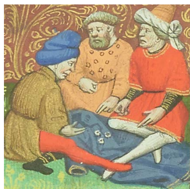
Ilustración 15: Ms. NAL 3261, f. 1r, circa 1425-1435.

Las siguientes representaciones artísticas que he querido seleccionar, para establecer una comparativa en la plasmación de escenas cotidianas en torno al juego más