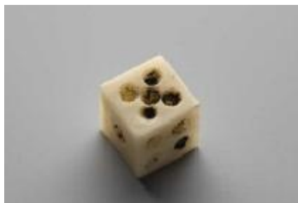
Ilustración 6: Dado en hueso, ss. X-XIII, Museo del Teatro de Caesaraugusta (Zaragoza) Perteneciente a la cultura islámica. Consultable en CERES.

De nuevo los registros de los peajes aduaneros y el vocabulario de comercio medieval aragonés permiten acercarse a la materialidad de este objeto, y analizar determinados aspectos a través de las anotaciones del tráfico mercantil. A pesar de la constatación del intenso tráfico de estos objetos a fines del periodo medieval, Agudo Romeo (2004) señala que el fuero de Montalbán prohibía expresamente el juego con dados, la tenencia de este objeto y, además, el vender o alquilar de forma oculta o manifiesta dados, aleas y tablas dentro de la villa y de sus términos bajo pena de mutilación de mano al vecino infractor o de horca al forastero que incumpliese la norma. Sin embargo, las normas forales locales debieron caer pronto en desuso, a la par que fue creciendo la afición por todo tipo de juegos de dados y, sobre todo, la tolerancia social hacia una actividad lúdica en teoría muy perseguida por ocasionar graves problemas de orden público y moral. Precisamente la tolerancia social –unida al hecho de que cada jugador llevaba encima y utilizaba sus propios dados en los lanzamientos, desechando con frecuencia los que no le habían dado suerte–, es la única explicación factible para los miles de dados que diariamente circularon por las rutas comerciales aragonesas, a tenor de la información aportada por esa pequeña ventana abierta a la realidad cotidiana del tráfico de dados como son los registros aduaneros.