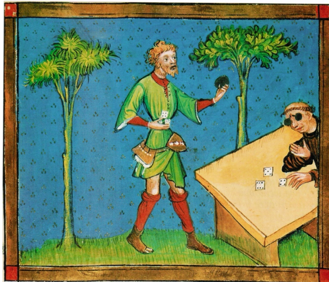
Ilustración 7: Jugadores de dados, uno de ellos clérigo, en un manuscrito alemán de Konrad de Ammenhausen, Schachzabelbuch , s. XIV. Consultable en: https://www.flickr.com/photos/16641203@N08/11359601466