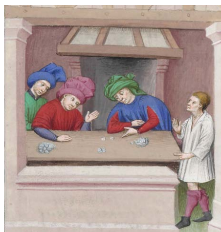
Ilustración 13: BnF, Catálogo Mandragore, Ms. 5070 réservée, f.330v., principios del s. XV.