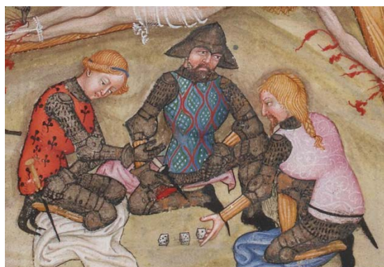
Ilustración 14: BnF, Catálogo Mandragore, Ms. Latin 757, f. 79v, finales del s. XV.