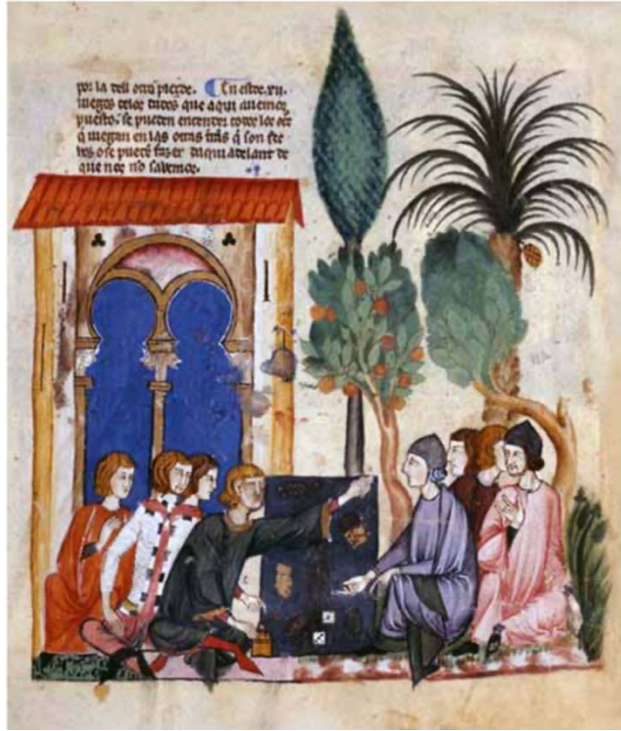
Ilustración 10: Miniatura del Libro de los Juegos de Alfonso X el Sabio que representa una partida de dados con apuestas en un espacio exterior (f.65r.)