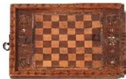
Ilustración 8: Tablero de juegos en madera de nogal, abedul y hueso, con clavos en metal y asas en hierro. Pertenece a la Cultura Nazarí, datada en el periodo de 1232-1492. Museo de la Alhambra (Granada). Consultable en CERES

Sobre el tema de los materiales, la composición del tablero podía ser de madera, hueso, piedra o incluso cerámica. Estas piezas también podían estar grabadas en las paredes de edificios como iglesias 39 , o en superficies planas como mesas, pero de forma general se producían de forma exenta. Actualmente, tenemos ejemplos de ellos en localizaciones como Granada, Oviedo, León o Zaragoza, aunque también aparecen en más territorios, pues su difusión fue muy amplia.