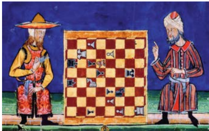
Ilustración 11: Miniatura del Libro de los Juegos de Alfonso X el Sabio que representa a un judío y a un musulmán jugando al ajedrez. s. XIII. (f.63v.)