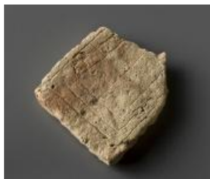
Ilustración 9: Fragmento de tablero de juego, hecho en cerámica rosa y datado entre 901-1200. Pertenece a la Cultura islámica. Museo del Teatro de Caesaraugusta (Zaragoza). Consultable en CERES.