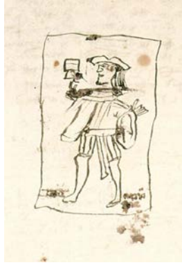
Ilustración 3: Dibujo de Naípe con la sota de copas, fecha aproximada 1490, Archivo de la Real Chancillería de Valladolid (España). Consultable en Pares