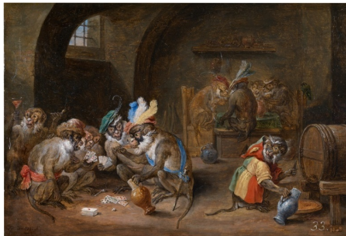
Ilustración 17: Monos en una bodega, hacia 1660, óleo sobre tabla. David Teniers. Procedente de la Colección Real (Palacio de Aranjuez, Madrid). Museo del Prado.