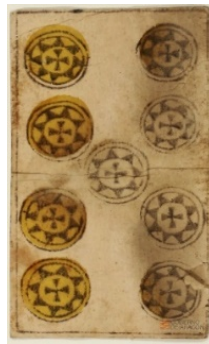
Ilustración 4: Un Naípe: 9 de oros- Siglo XVI; Archivo Provincial de Huesca. Consultable en DARA

Para finalizar, algunos autores recogen multitud de modalidades de prácticas lúdicas con naipes, que responden a la gran popularidad que tuvieron desde el periodo medieval hasta la actualidad 28 . Pero, sin duda, la modalidad que aparece citada por su nombre en la documentación que hemos consultado es la gresca o grezesca , altamente perseguida por su afición entre los jugadores lícitos, pero también entre los tramposos y truhanes de la Corona de Aragón. El vocablo ha evolucionado hasta el actual de brisca , desconociendo si seguía reglas de juego similares a la brisca moderna o contemporánea, al no haber testimonios escritos de normas en la documentación medieval conservada. Tampoco tenemos noticias de si las cartas se utilizaban sobre un tablero o trapo como soporte de juego, o si se jugaba sobre una mesa o directamente sobre el suelo, interponiendo algún tapete o tabla.