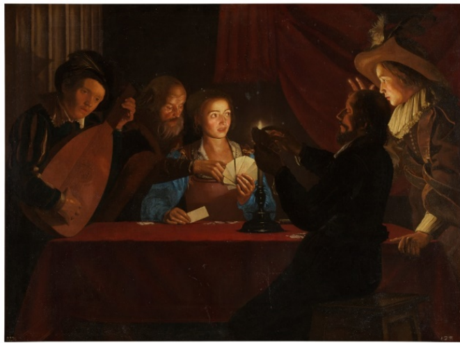
Ilustración 16: Jugadores de Naipes, s. XVII, óleo sobre lienzo. Autor anónimo. Procedente de la Colección Real (Palacio de El Pardo, Madrid). Museo del Prado.

realistas son del siglo XVII. Momento de auge y esplendor del barroco, un período histórico y artístico que, desde el punto de vista pictórico, dio pie a nuevos temas de representación como los costumbristas, en los cuales se plasmaron cuestiones vulgares o cotidianas como las partidas de cartas, ya sea representadas de forma fidedigna o de forma alegórica, como sucede en la segunda obra en la que el artista David Teniers, «sintetiza con acierto la ambivalencia de la humanidad de su naturaleza animal, [...], censura sin acritud, ni dramatismo, los vicios del juego, el vino y el tabaco» 47 representando a los seres humanos como monos.