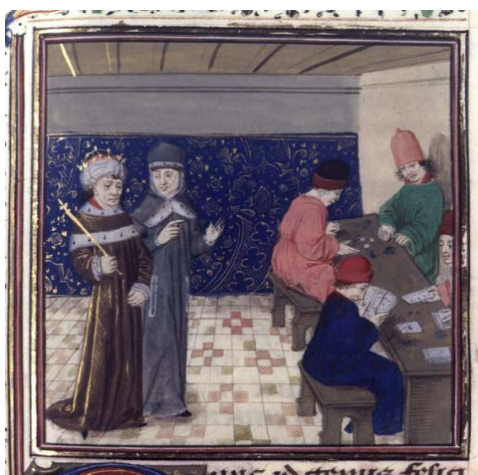
Ilustración 12: BnF, Catálogo Mandragore, Ms. Fr 289, f. 318r; circa 1470-1480.

En los manuscritos iluminados de la Biblioteca Nacional de Francia también hemos localizado cuatro interesantes miniaturas que representan distintos espacios donde los jugadores de cartas y de dados daban rienda suelta a su afición. En la primera de ellas, bajo la mirada atenta del dueño de la casa, varios jugadores de distintos grupos sociales se hallan sentados ante unas mesas jugando a las cartas; en la segunda, dos jugadores de dados echan sus suertes y muestran sus apuestas sobre la mesa mientras que otro jugador que ha perdido hasta sus ropas contempla la escena; la tercera y cuarta imagen muestran las partidas de dados callejeras en las que, en ocasiones se utilizaba como tapete de juego una camisa o capa. Todas las ilustraciones pertenecen a manuscritos del siglo XV de distinta procedencia y, en alusión a temáticas religiosas o de la antigüedad romana, los artistas aprovecharon para proyectar imágenes de su vida cotidiana.