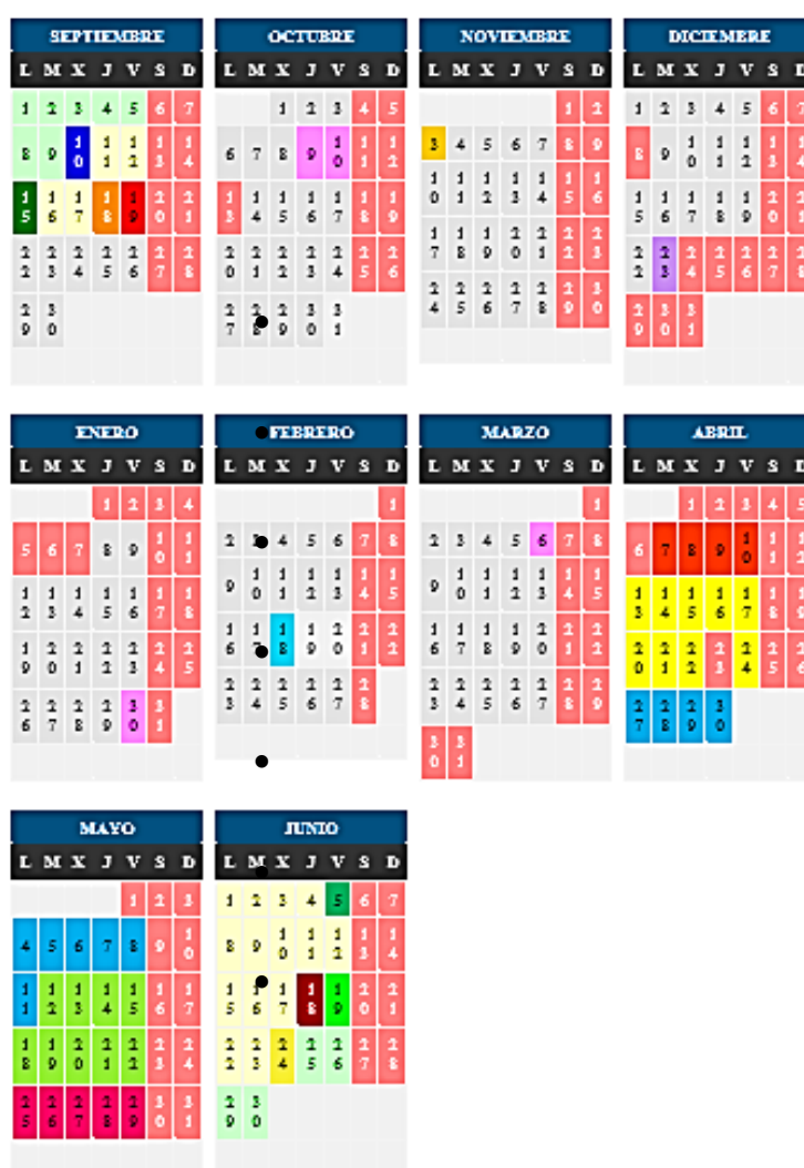
Figura 2. Calendario escolar 2014/2015.

En cuanto a la organización temporal, el proyecto esta propuesto para el último trimestre del año, ya que la representación de la obra se llevará a cabo en la Fiesta de final de curso . Se desarrollará en el horario de tardes, de manera alterna, es decir, los lunes, los miércoles y los viernes durante los dos meses que poseen este horario, en sesiones de una hora y media, formando un total de 33 horas de proyecto educativo. Las horas de las sesiones se distribuirán basándonos en el calendario escolar del año 2014/2015, de la siguiente manera: