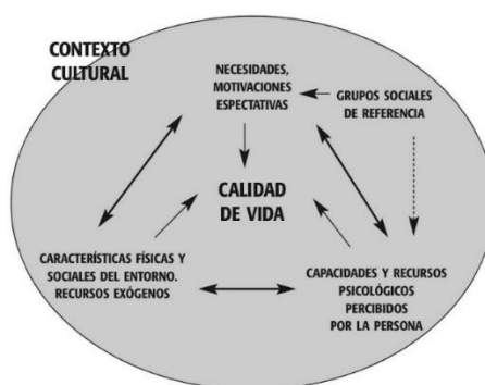
Ilustración 1 - Modelo de Hernández y Valera (2001), recogido en Gatica, F (2016)

Por tanto, para intervenir hace falta comprender y ordenar la complejidad de interacciones que tiene cada individuo con el entorno y las conexiones con el grupo o comunidad de estudio. En el modelo de Gatica (2016) que se puede ver a continuación en la imagen para modificar la calidad de vida de una persona se debe analizar las necesidades, motivaciones y expectativas, sus características, capacidades y recursos para hacernos una idea del impacto que tienen los grupos sociales de referencia o grupo de estudio y por último el contexto social y cultural que lo rodea.