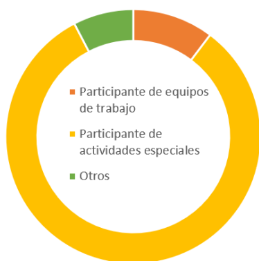
Participación en personas sin discapacidad