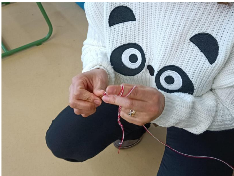
Fotografía de la realización de una pulsera