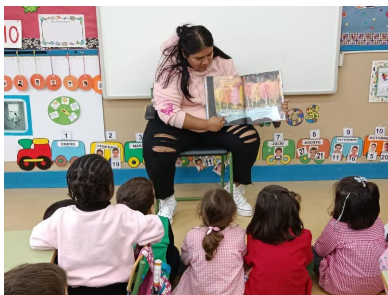
Foto representativa de la lectura Nos vamos de fiesta