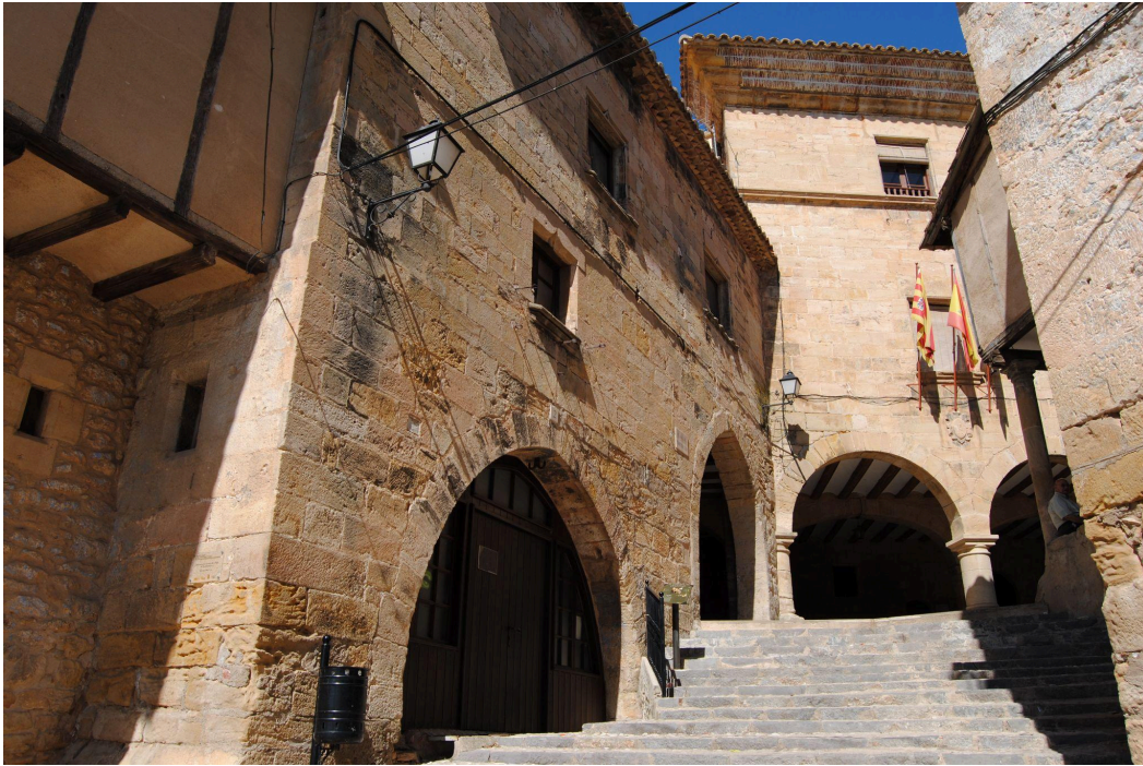
Plaza del ayuntamiento

Nota: Foto cedida por César Lombarte Omella