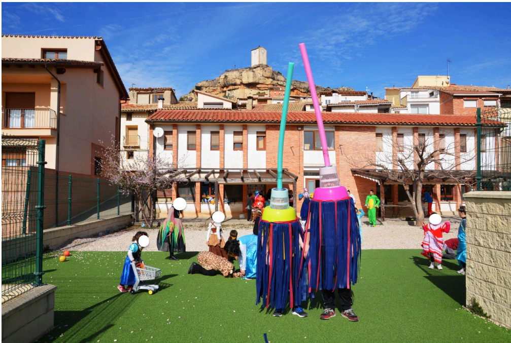
Nota: Foto cedida por César Lombarte Omella