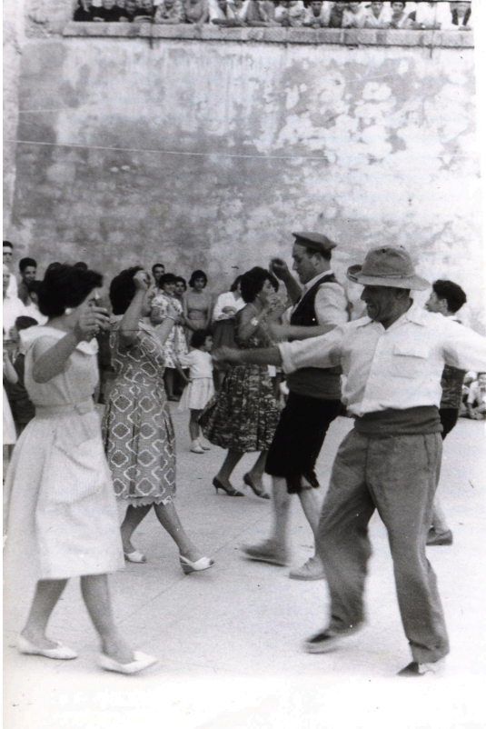
Nota: Foto cedida por César Lombarte Omella