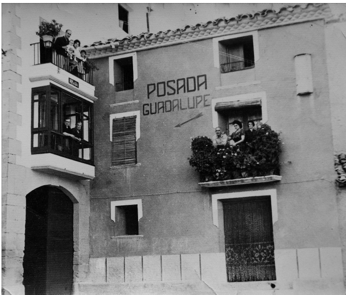
Nota: Foto cedida por César Lombarte Omella