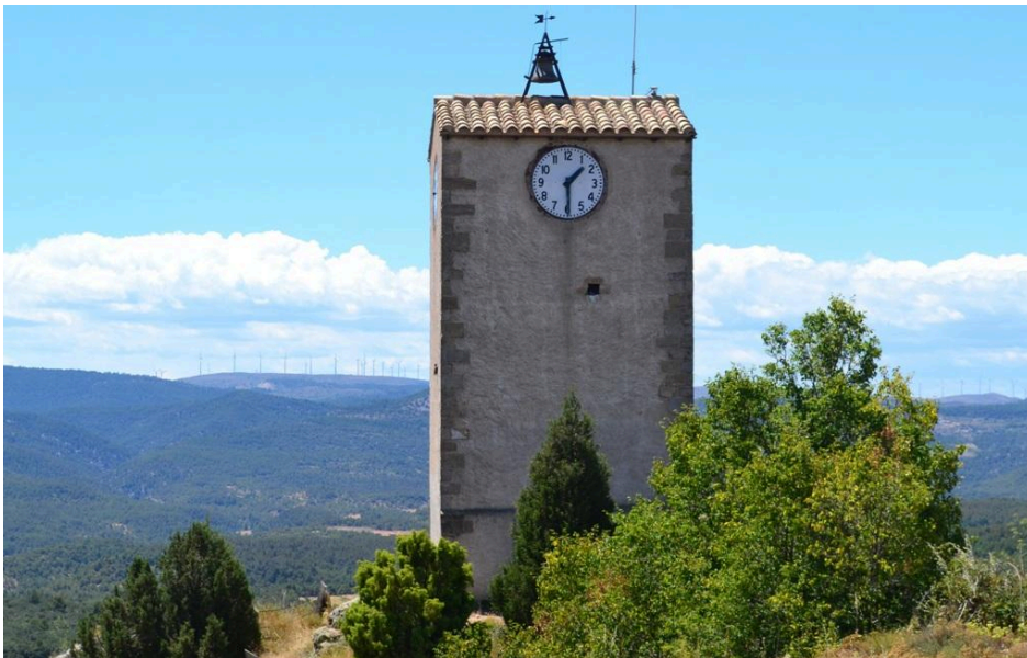
La torre del reloj