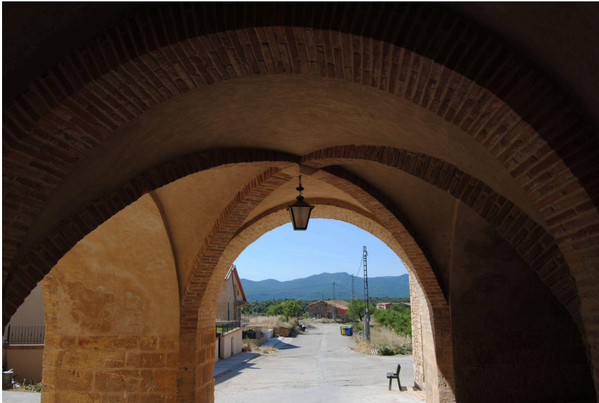
Foto del portal de Santo Domingo 2020