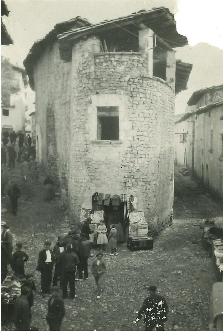
Nota: Foto cedida por César Lombarte Omella