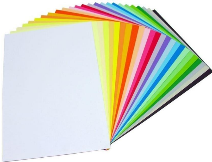
Figura 3. Cartulinas