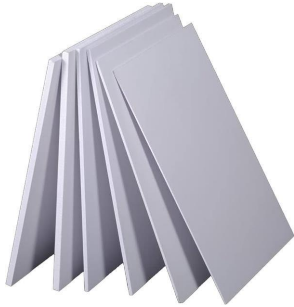
Figura 5. Cartón pluma