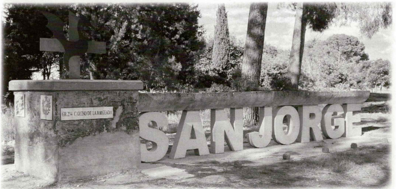
Figura 3.- Vista del monumento de San Jorge