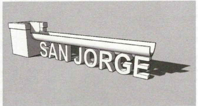
Figura 1.- Diseño del monumento de San Jorge

Con todo lo anteriormente expuesto, y por la particular vinculación de esta ruta con este pueblo, desde el inicio se pensó que su señalización debía ser igualmente especial. En