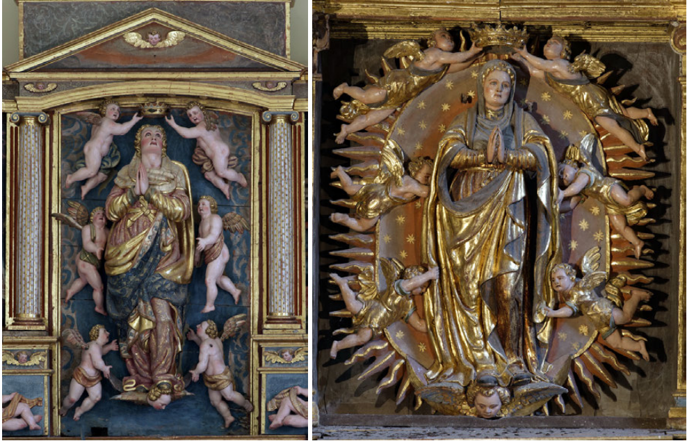
Fig. 12. Asunción-Coronación. Retablo mayor. Jerónimo Nogueras. H. 1580/81-1582. Parroquia de San Miguel, Jalón de Cameros