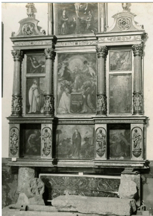
Fig. 20. Retablo de N ª S ª de la Piedad del monasterio de Veruela. Jerónimo Nogueras (mazonería) y Antón Galcerán (pinturas). 1586. Ubicación actual desconocida.

pintor flamenco Rolan Moys 45 (doc. 1571-1592, †1592). Aunque ignoramos el paradero actual de este retablo, conocemos su aspecto a través de una fotografía de no muy buena calidad 46 (Fig. 20). Su diseño es más convencional que el del retablo de Murero, pues presenta una solución en sintonía con los postulados del Segundo Renacimiento aragonés que debieron pergeñar Galcerán y Moys, aunque el documento no lo precisa. A destacar el empleo de columnas corintias anilladas al tercio del imoscapo decorado con niños entre cartelas y la incorporación de relieves de los evangelistas en los netos, al nivel de la predela, apoyados en ménsulas e incluidos en hornacinas planas, cuyo estilo es difícil escrutar a partir de la fotografía si bien parece seguir una línea coherente con las tallas de San Pedro y San Pablo de Murero.