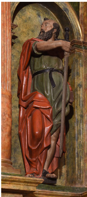
Fig. 19. David-Apolo . Miguel Ángel Buona- rotti. H. 1530. Museo Nacional del Bargello, Florencia