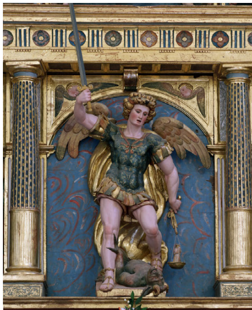
Fig. 11. Imagen titular. Retablo mayor. Jerónimo Noguerras. H. 1580/81-1582. Parroquia de San Miguel, Jalón de Cameros (La Rioja).

lor, ya que permite asignarle los elementos escultóricos (Figs. 10-12) de esta singularísima máquina camerana de pintura e imaginiería.