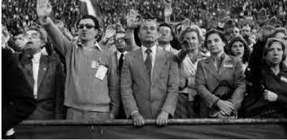
Imagen de Leon Degrelle observando un mitin en España. Nótese que por los gestos de las personas de su alrededor, no tuvo problemas para adaptarse en el país.