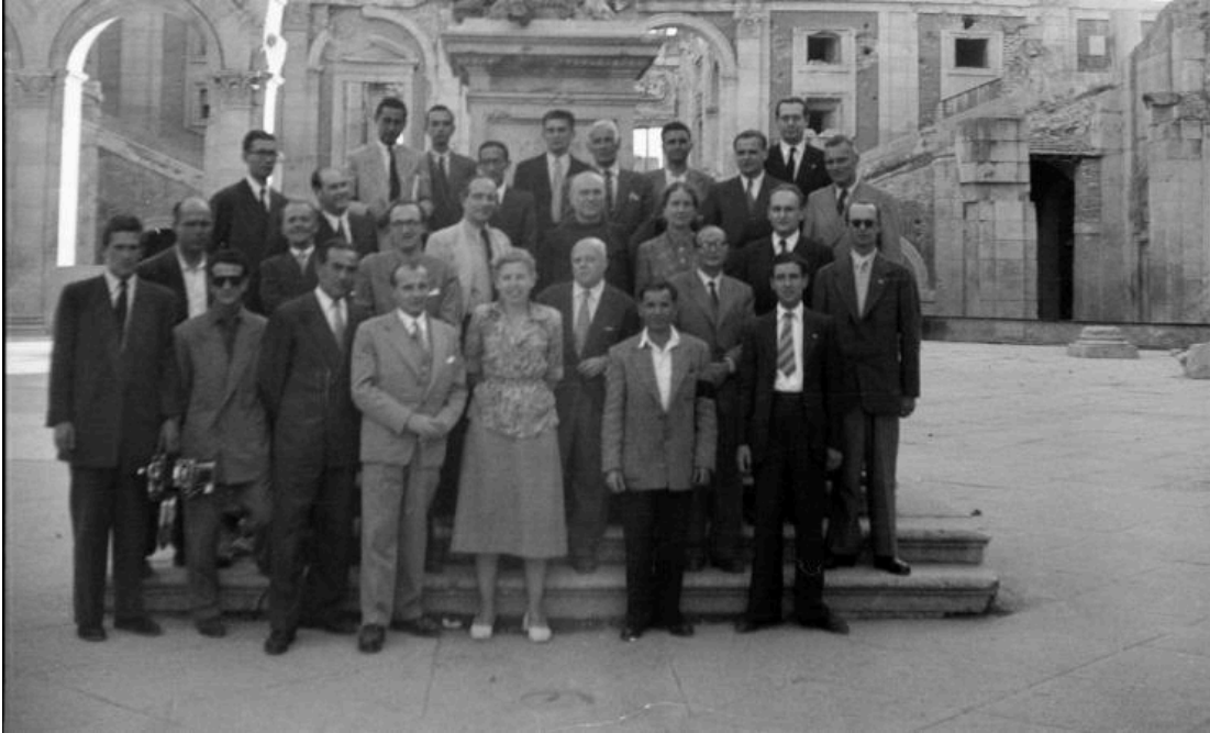
Imagen de algunos presentes de la Internacional Fascista de 1951. En esta fotografía se encuentran en el Alcázar de Toledo. Hay algunos importantes líderes del fascismo europeo.