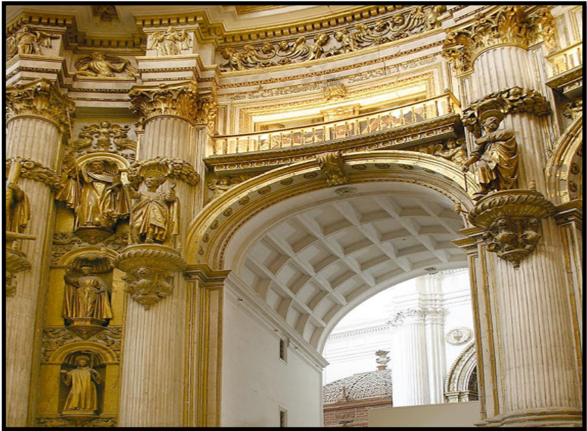
Fig. 8. Galerías y pasillos de la catedral