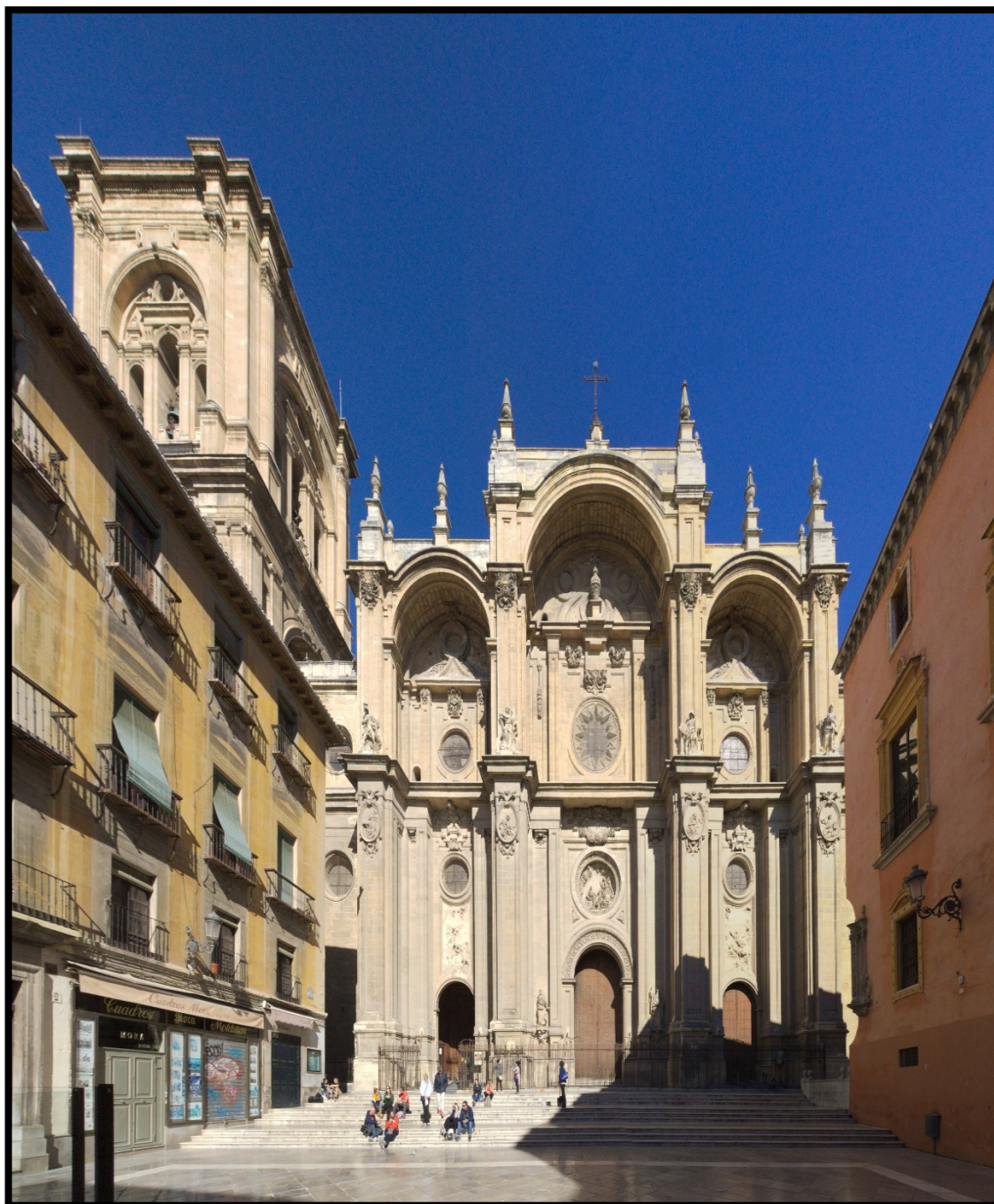
Fig. 1. Catedral Metropolitana Basílica de la Encarnación. (Fachada de la catedral de Granada)