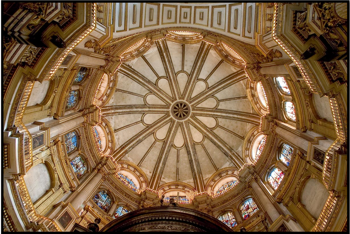
Fig. 6. Cúpula de la capilla mayor.