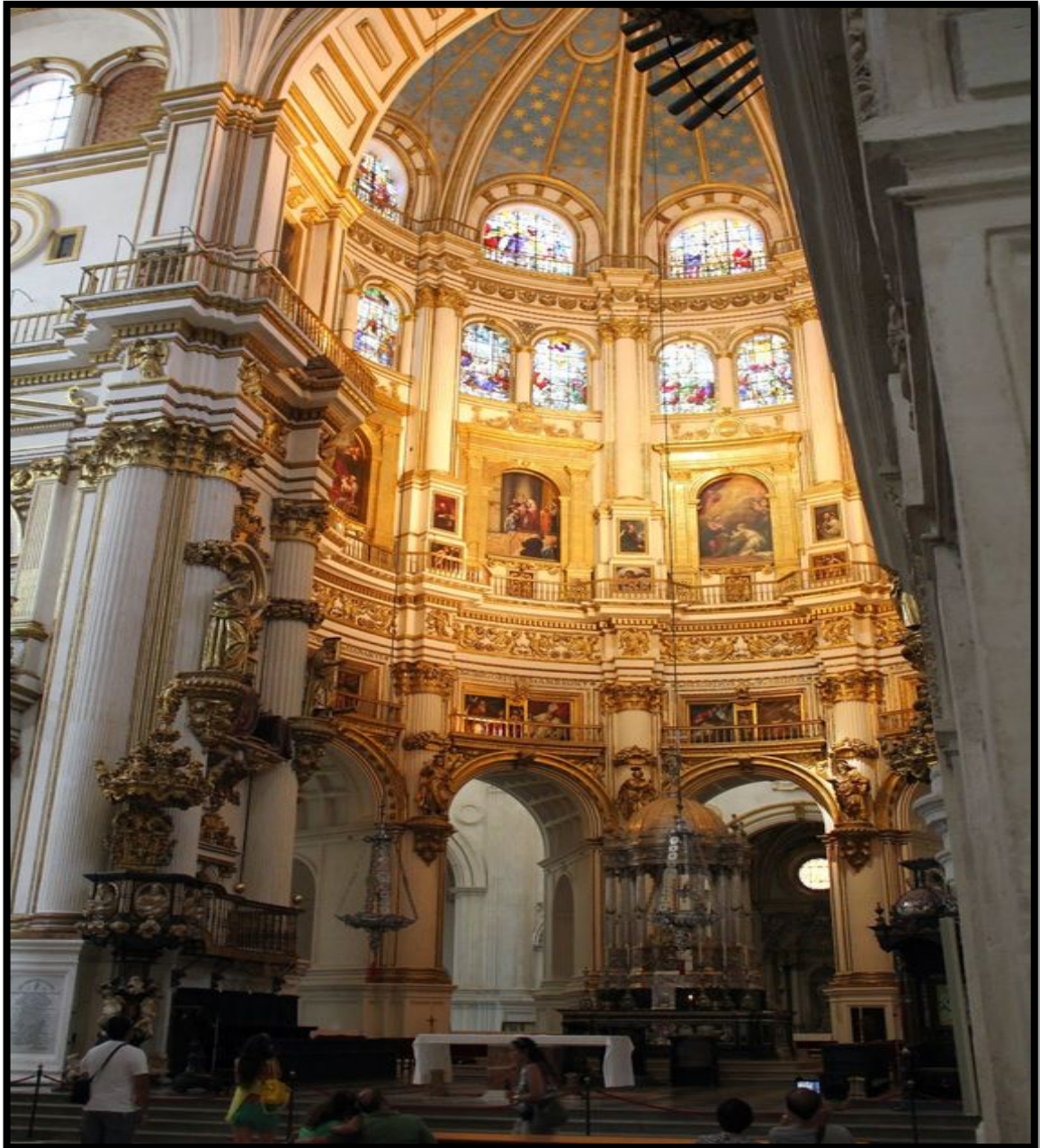
Fig. 3. Presbiterio de la catedral de Granada, diseñado por Diego de Siloé.