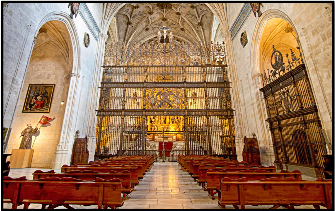
Fig. 5. Iglesia de la Capilla Real de Granada.