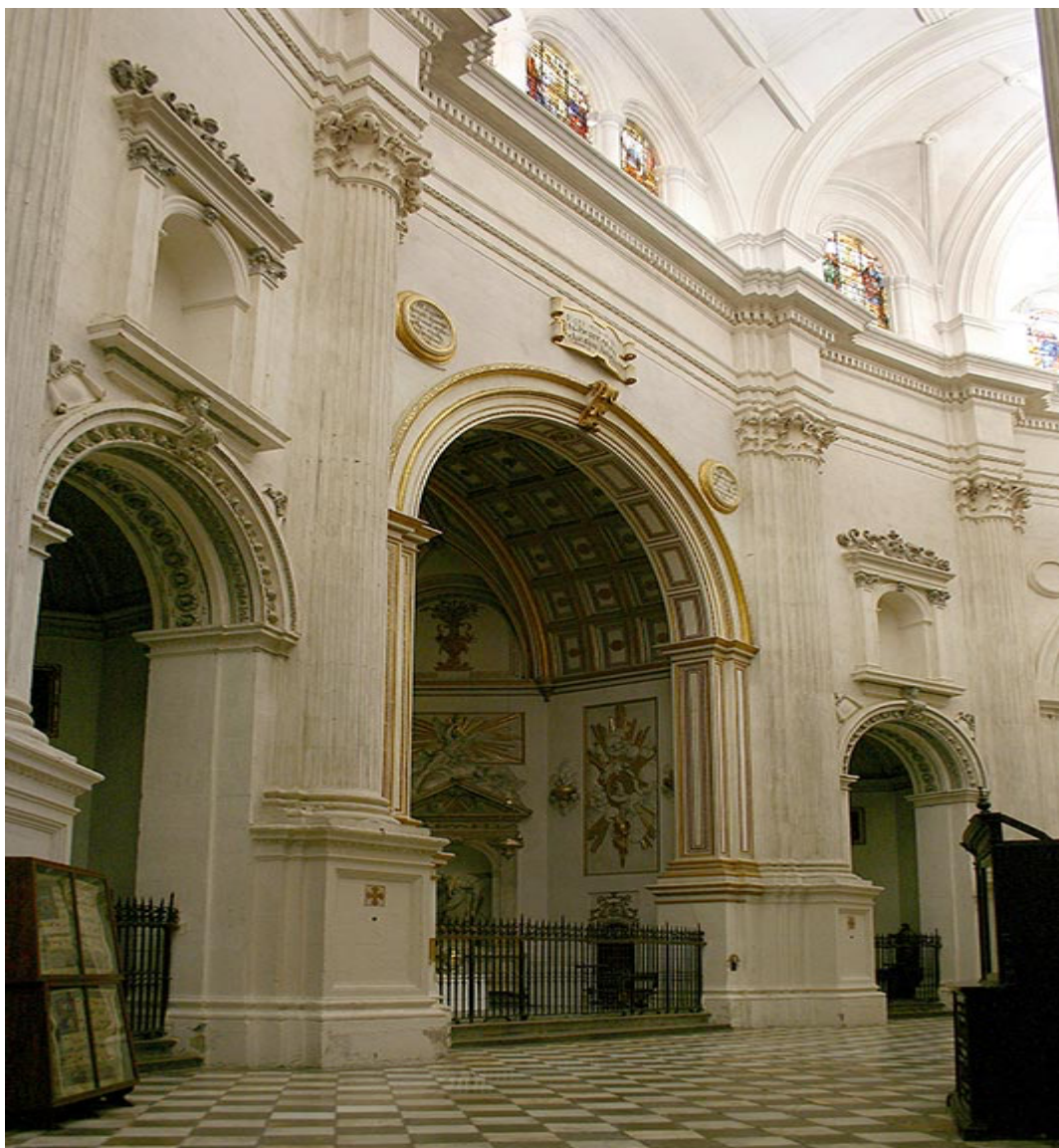
Fig. 7. Girola de la catedral de Granada desde el interior.