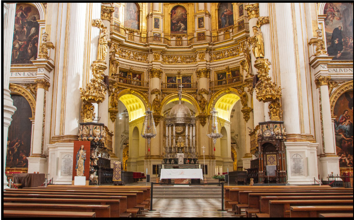
Fig. 2. Altar compuesto por Siloé entre 1528 y 1561 para la Catedral de Granada.