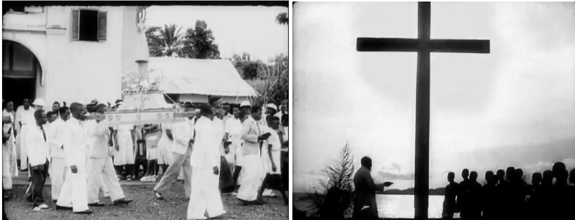
Fig. 5 Fotogramas del inicio (izq.) y final (drcha.) del cortometraje Una cruz en la Selva .