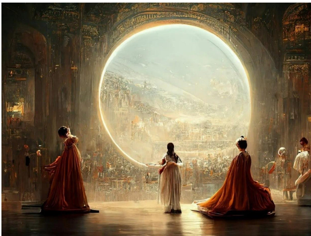
Figura 1: Théâtre D'opéra Spatial 1

Me gustaría comenzar con la siguiente pregunta, ¿Es la imagen aquí presentada arte? La respuesta más habitual sin otra información más allá de la propia imagen suele ser sí, en efecto, esta obra es arte. Esta imagen, a primera vista, supliría los requisitos técnicos de cualquiera para posicionarse como arte, incluso del crítico más escéptico, esencialista o conservador. De hecho, si este crítico se parase a observar la obra seguramente podría reconocerle un aura. Antes de continuar con el ensayo he de aclarar que cada vez que hable del aura respecto a una obra de arte voy a hacerlo en el sentido en el que lo hacía Walter Benjamín, como “la aparición irrepetible de una lejanía por cercana que pueda estar” 2 . Ese aura es sinónimo de un halo alrededor del arte que