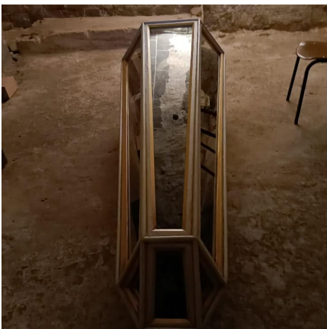
Figura II. Reconstrucción de la urna de 1929