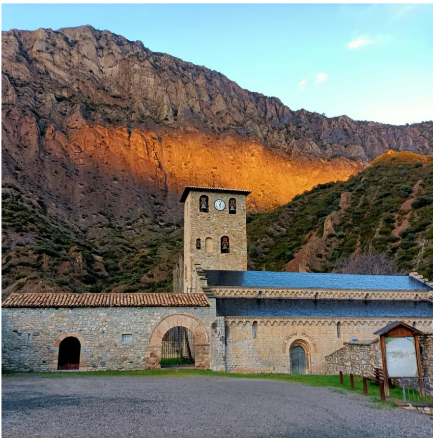
Figura I. Iglesia del monasterio de Santa María de Alaón.