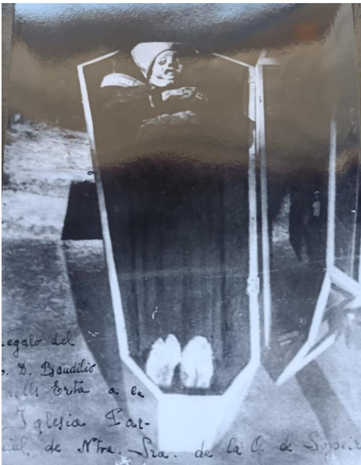
Figura IV. Imagen original del "Cos Sant" realizada por Baudilio Fornells, cura de Sopeira