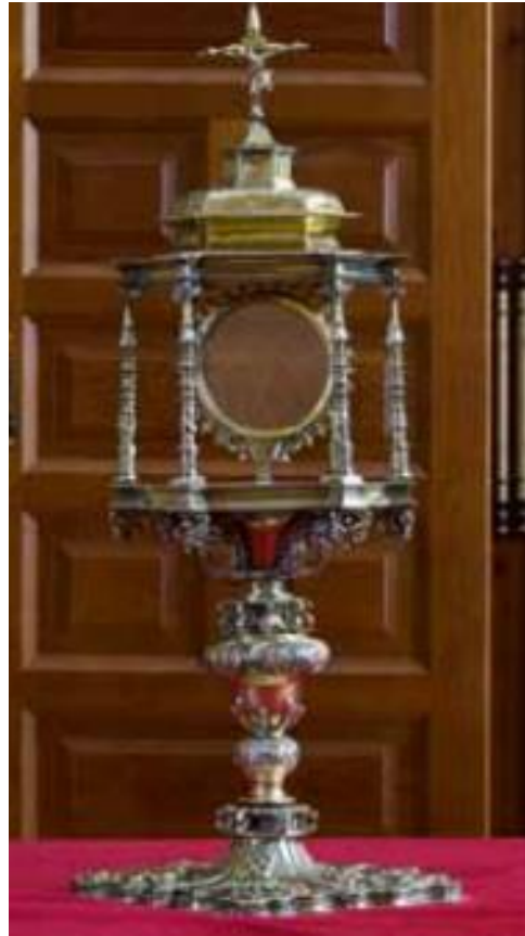
Figura VIII. Custodia de la iglesia de la Natividad de Nuestra Señora, de Andorra