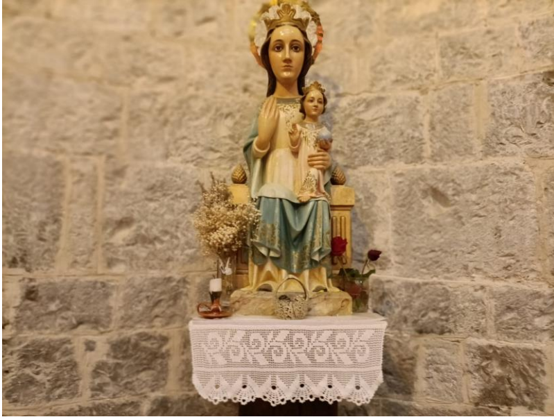
Figura V. Nuestra Señora de la O