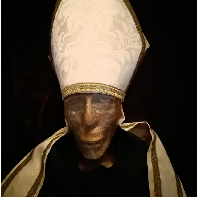
Figura III. Reconstrucció en cera del "Cos Sant"