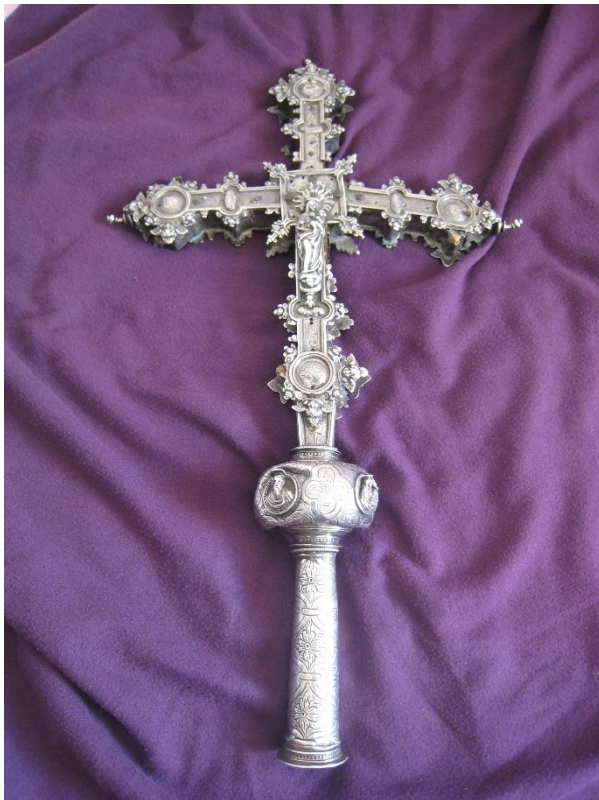
Figura VI. Cruz de plata