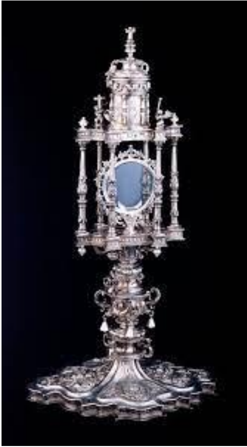
Figura VII. Custodia renacentista del Monasterio de Santa María de Alaón