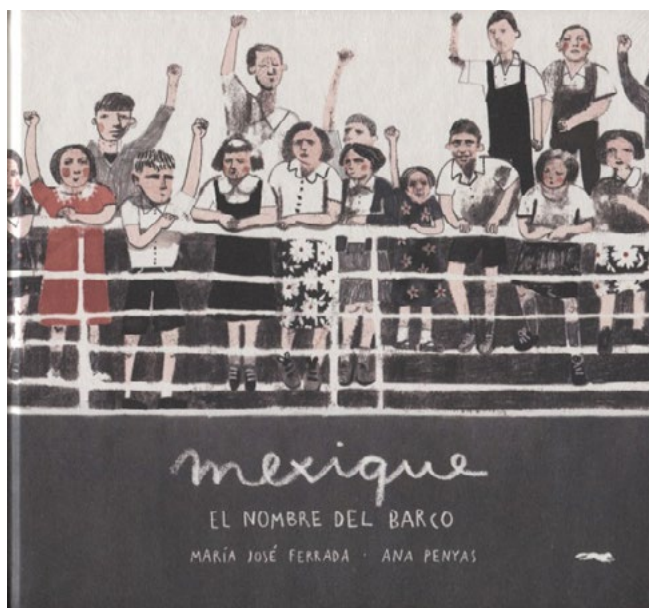
Figura 1. Portada de Mexique

El libro presenta unas ilustraciones muy expresivas en tonos apagados y sin apenas uso del color, que consiguen retratar lo que pudo significar ese viaje para aquellos niños a través de un diálogo visual sincero y emotivo, pues logra transmitir emociones muy próximas a la sensibilidad infantil. La técnica del collage ahonda en una propuesta de hibridación que camina entre la realidad y su versión ficcionada, de forma magistral, en la voz poética con la que María José Ferrada se hace eco del suceso. Texto e imagen se complementan de nuevo, pues esta presencia visual que inunda inevitablemente las páginas del libro va acompañada de un texto formado por breves estrofas donde se evidencia la voz poética de un niño que cuenta en verso libre un viaje cargado de miedo, incertidumbre, esperanza e inocencia. El lector se sitúa en la fragilidad de la historia por lo conmovedora que resulta y se sumerge en un mar de emociones de la mano de los versos del niño (“No recuerdo bien dónde está el país al que iremos/ pero queda lejos./Estaremos hasta que todo se calme./ Tres o cuatro meses./ Como unas vacaciones un poco largas. Eso dijo mi mamá./ Mi mamá que cuando se despidió dijo “mi niño”.) junto con esas imágenes cargadas de detalle que van al compás de los acontecimientos: el barco lleno de niños que zarpó desde Burdeos hacia México para no regresar jamás (Véase figura 2).