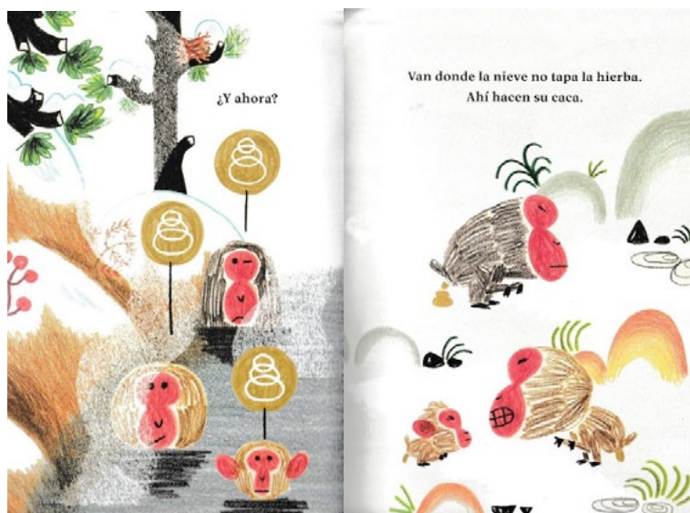
Figura 4. Páginas interiores de Onsen

monos lanzando, además, preguntas sobre lo que el lector cree que pueden sentir los protagonistas a tenor de lo que las imágenes reflejan. De esta manera, se presenta una obra a modo de acertijo o adivinanza, pues las ilustraciones reflejan a los monos en acción con una serie de pequeños bocadillos sobre sus cabezas que encierran distintos pictogramas para que el lector adivine el sentido de la comunicación.