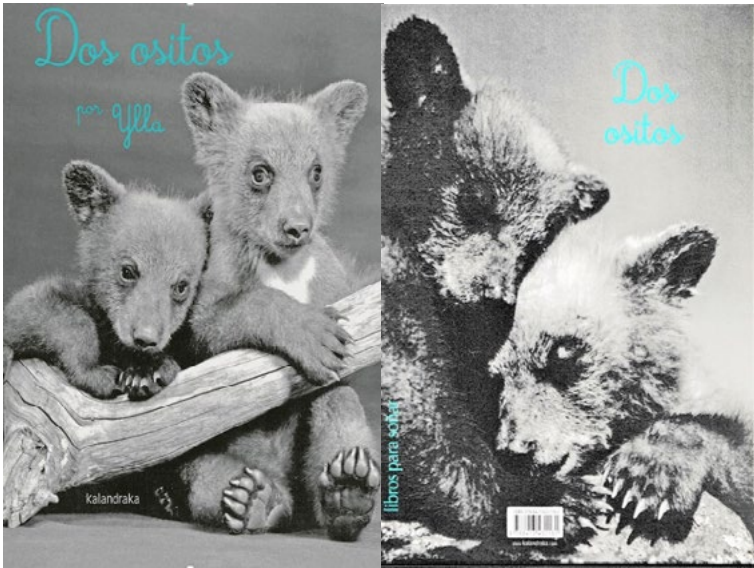
Figura 5. Cubierta y contracubierta de Dos ositos

La relación que la obra ofrece entre imagen y texto es complementaria en cierto sentido (Nikolajeva y Scott, 2001; Van der Linden, 2015). Es decir, se inscribe este relato en la tradición del álbum narrativo, con la peculiaridad de que las imágenes llenas de belleza realizadas por Ylla aportan a la historia un tono documental que la hace caminar entre las fronteras de la ficción y la no ficción. La historia sigue los patrones clásicos de la narrativa tradicional: “Dos ositos, hermano y hermana, se asomaron al mundo. Habían nacido durante el invierno, bajo la nieve que cubría su cálida cueva”. De manera tierna y entrañable se va narrando la travesura de los dos ositos que salen del hogar sin el permiso de la mamá osa y así, tras la diversión y admiración de los cachorros ante un mundo desconocido y nuevo para ellos, lleno de animales con los que hablan y de plantas con las que juegan, llega el momento de regresar a casa y encontrar a su mamá. Con la ayuda de los animales del bosque, la propia mamá osa será la que encuentre a sus cachorros y lejos de regañarlos o enfadarse, los acoge en su regazo en un amable y dulce regreso al hogar.