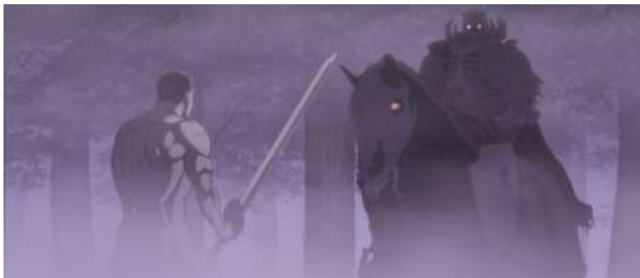
El tercer acto de la trilogía mantiene un tono mucho más oscuro.

Pero, como sabrán también los habituales del manga y el anime de Berserk , aquellos que busquen las partes clave y, por ende, más poderosas a nivel visual y emocional del manga, encontrarán en este tercer DVD (o Blu-ray) diversión asegurada. Aunque con ello -como el lector habrá deducido- llegarán también imágenes impactantes, en muchas ocasiones, hasta el desagrado. El efecto se consigue perfectamente gracias a una animación muy cuidada (que combina imágenes en 2D con otras en 3D, en un todo muy realista visualmente), que detalla a la perfección las escenas de lucha o con mayor carga épica, potenciada si cabe por la música compuesta por Shirô Sagisu , uno de los compositores de referencia para el estudio GAINAX (de donde surgió Neon Genesis Evangelion ) y, en la actualidad, para la serie de anime Bleach . Está también presente la música del genial Susumu Hirasawa a través de su épica Aria , dando lugar a un conjunto que resulta francamente espectacular y hace de esta película la más recomendable de la trilogía y una de las mejores adaptaciones al anime del mangade Kentaro Miura. Además, la edición incluye toda una serie de extras (varios de ellos vinculados a la banda sonora) que acaban de redondear la compra y la hacen francamente recomendable. Es decir, la película puede aportar una experiencia francamente buena, pero, al igual que en la reseña que realizamos del manga, hacemos una última recomendación al lector: Berserk no es apto para estómagos sensibles.