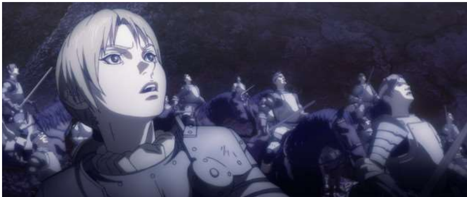
Imagen de Berserk. La edad de oro III, El advenimiento , en uno de los momentos clave.