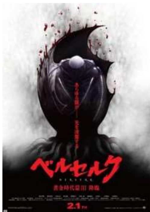
Portada de la versión japonesa de Berserk. La edad de oro III, el advenimiento.