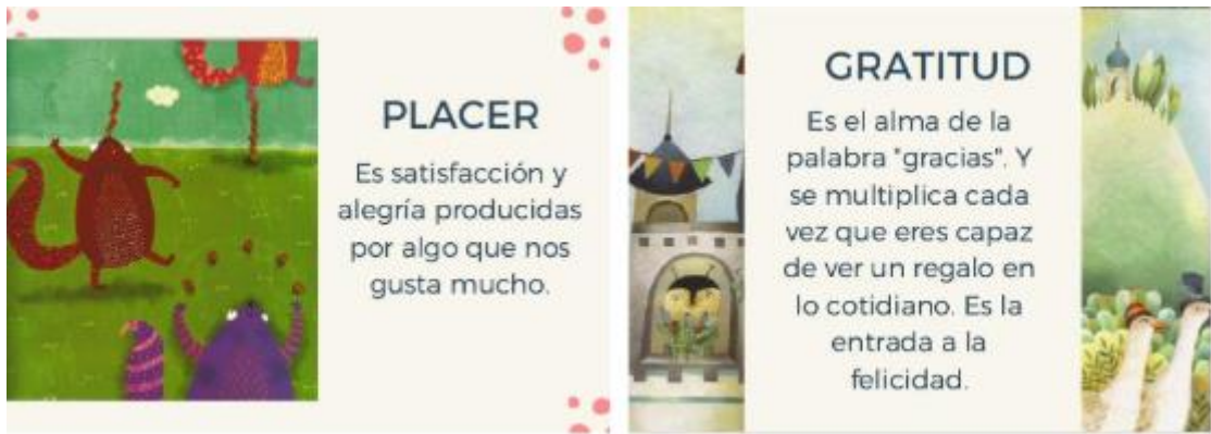
Figuras 1-20: Tarjetas de las emociones