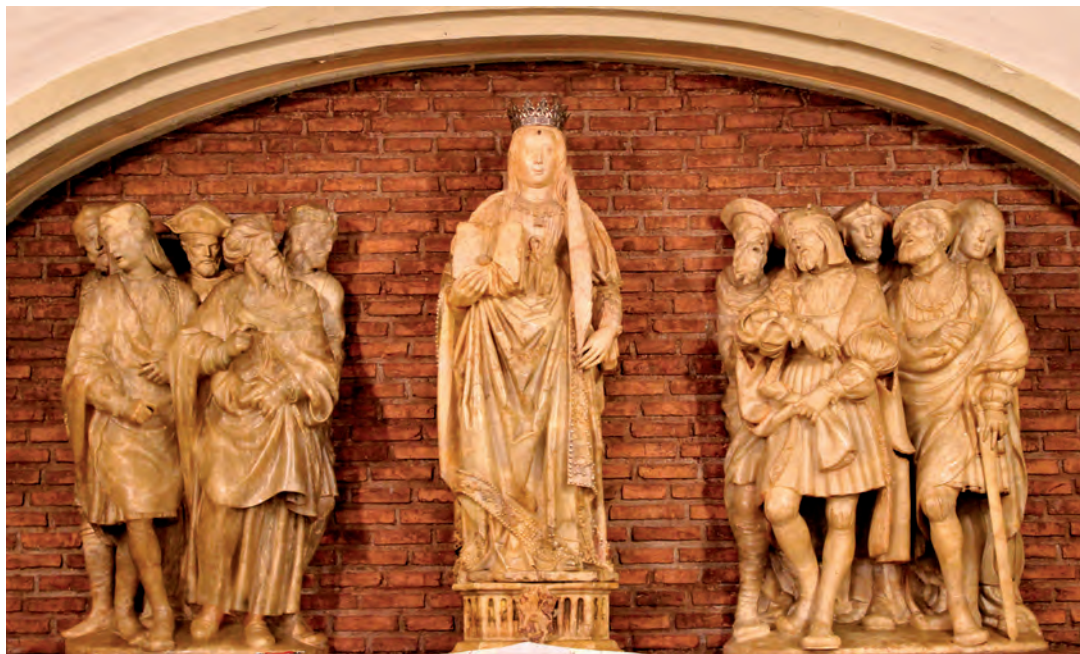
Fig. 5. Estado actual del conjunto escultórico en alabastro que preside la cripta.