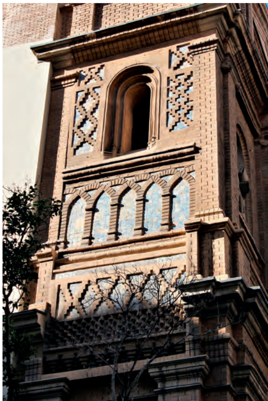
Fig. 3. Detalle de los únicos restos conservados de la fábrica gótico-mudéjar en el lateral de la torre izquierda.