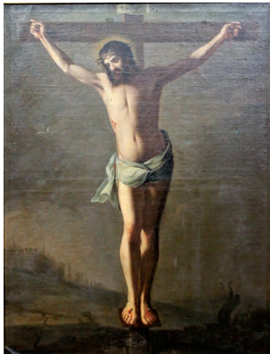
Fig. 8. Cuadro de autor desconocido que representa a Cristo crucificado. Zaragoza, parroquia de Santa Engracia.

en el desierto de José Luzán Martínez y el retablo mayor, cuya parte escultórica (y tal vez la traza del mismo) corrió a cargo del joven Lamberto Martínez Lasanta, discípulo de José Ramírez de Arellano. Como ya dejó anotado Faustino Casamayor (1795: 116r y ss.), muy destacada fue la participación en este proceso ornamental de Francisco Bayeu, quien entre 1761 y 1763 pintó al fresco en las pechinas de la cúpula elíptica cuatro representaciones de Santos Doctores (según Antonio Ponz) o bien de los santos mártires de devoción local Valero, Braulio, Prudencio y Eugenio (según Juan A. Ceán Bermúdez); sobre el altar mayor, en un luneto en arco apuntado, la Santísima Trinidad en la Gloria (cuyo boceto acabado se conserva en el Museo del Prado); el lienzo principal del altar mayor, con el Martirio de santa Engracia ; a ambos lados del presbiterio, sobre las puertas de la sacristía, otros dos del Nacimiento de Cristo y la Epifanía ; en el crucero del lado de la Epístola, un cuadro de la Sagrada Familia 43 y otro de San Juan Bautista ; catorce cuadritos de la vida de la Virgen para la sacristía; un retrato de Fernando VI para el monasterio; y una Virgen con el Niño para la celda del prior.