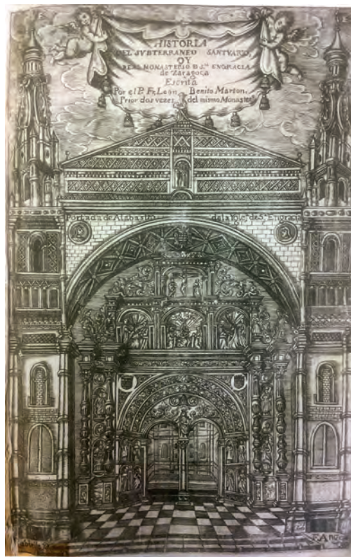
Fig. 4. Grabado a buril de fray Ángel de Huesca a partir de un dibujo de Pablo Félix Rabiella que sirve de frontispicio a la obra del P. Martón Origen y Antigüedades...

marcó la personalidad arquitectónica y decorativa del conjunto, mucho más que el gótico de inspiración nórdica (el llamado estilo “reyes católicos”), más visible en otras empresas reales, y que el emergente renacimiento, cuya presencia fue en general muy puntual y epidérmica, si exceptuamos la magnífica portada de los Morlanes y parte del claustro mayor. Ejemplo señero de la fase inicial del nuevo estilo “al romano” que iba permeando lentamente el arte hispánico en convivencia con el estilo precedente “a lo moderno”, esta portada fue concebida como un retablo arquitectónico en forma de arco de triunfo all’antica cobijado por un pórtico abierto. Junto con un fragmento decorativo situado en el lateral de la torre izquierda [fig. 3], esa portada es el único vestigio conservado de la iglesia alta primitiva, y por ello -y a pesar de las destrucciones y restauraciones sufridas-, se ha convertido en el principal símbolo parlante del monumento, con un programa iconográfico de exaltación de la orden jerónima y de la monarquía hispánica. 13 Del aspecto de esa portada con su pórtico y torres primitivos disponemos como único testimonio gráfico de un grabado a buril de fray Ángel de Huesca a partir de un dibujo de Pablo Félix Rabiella que sirve de frontispicio a la obra del P. Martón [fig. 4].