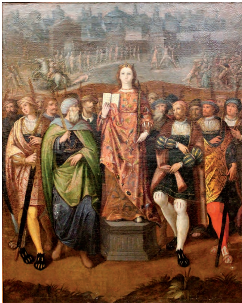
Fig. 6. Cuadro de autor desconocido que representa a Santa Engracia y los innumerables mártires. Zaragoza, parroquia de Santa Engracia.

fuera del rejado y en el mismo lado que la de San Esteban; y la de Santa Engracia, de la que paradójicamente no se dispone de mucha información.