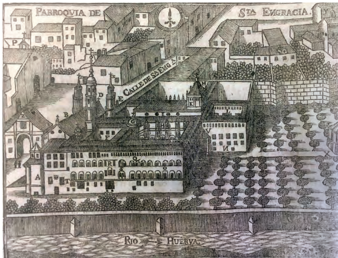
Fig. 2. Descripción, o mapa del Real Monasterio, y Parroquia de Santa Engracia de Zaragoza, grabado en madera de autor desconocido que ilustra la obra de fray León Benito Martón Origen y Antigüedades de el subterráneo y celeberrimo santuario de Santa María de las Santas Masas (Zaragoza, 1737).