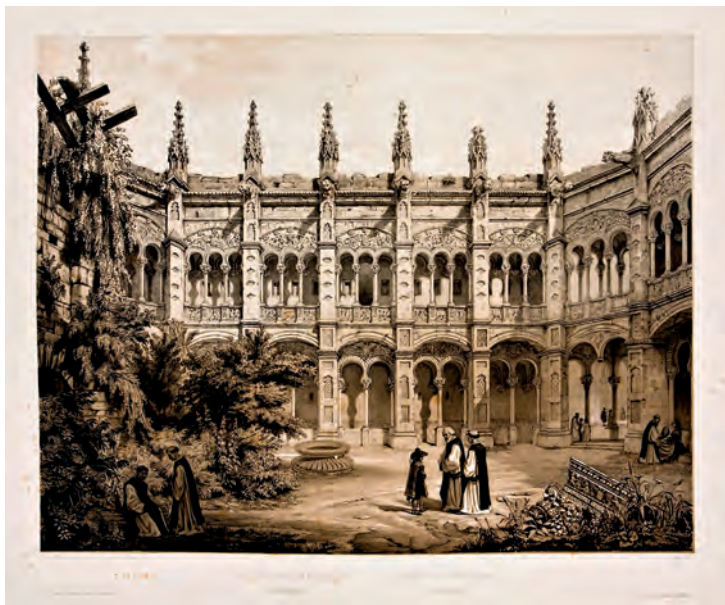
Fig. 9. Claustro de Santa Engracia en Zaragoza. litografía de Jenaro Pérez Villaamil a partir de un croquis de Valentín Carderera que ilustra la España artística y monumental de Patricio de la Escosura.