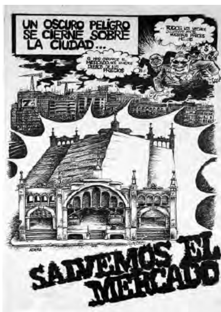
Fig. 3. Campaña “Salvemos el Mercado”, 1977.

del Mercado Central, una propuesta que irá adquiriendo intensidad hasta llegar a la aprobación del Plan Especial de la Vía Imperial, en 1973, que proponía conectar la puerta del Carmen con el nuevo puente de Santiago, inaugurado en 1967. Para lograr este objetivo “sobraban” muchas construcciones molestas: la iglesia y convento de Ntra. Sra. del Carmen, las manzanas de los primeros tramos de la calle del Azoque y la situada entre las calles de Cerdán y de las Escuelas Pías, que desembocaban frente al Mercado Central. Todo ello iba cayendo y desapareciendo como las piezas de un implacable juego de dominó.