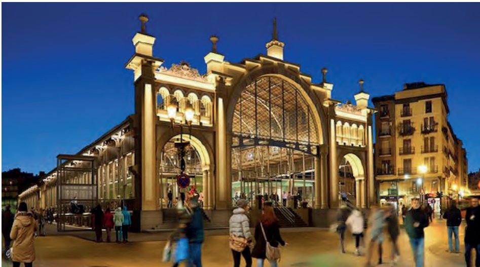
Fig. 6. Infografía de exterior del Mercado Central de Zaragoza, reinaugurado el 6 de febrero de 2020, con la nueva iluminación de led.