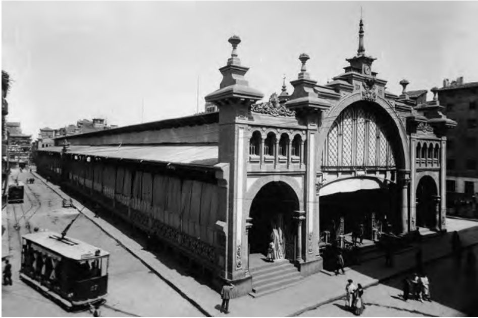
Fig. 1. Mercado Central de Zaragoza, 1903.