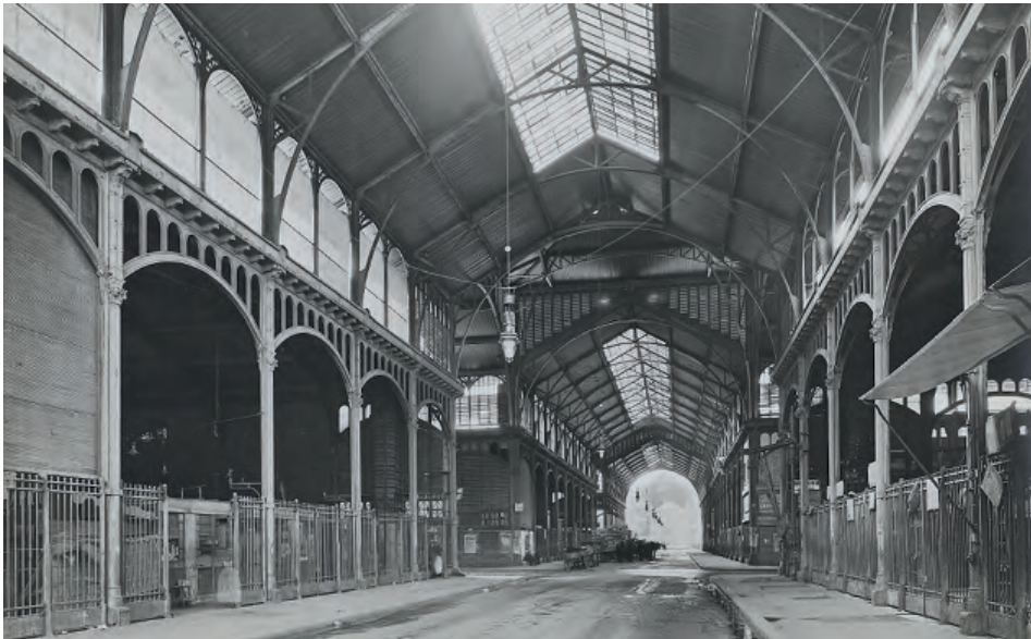
Fig. 2. Les Halles, el gran mercado de París, proyectado por el arquitecto Víctor Baltard en 1863 y terminado de derribar en 1973.