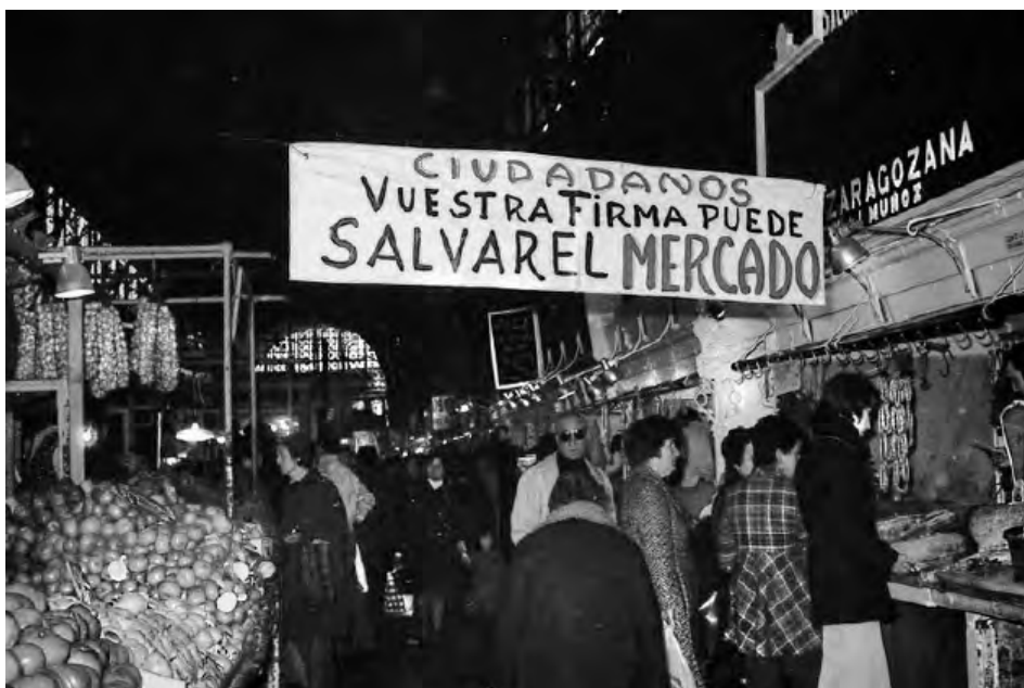
Fig. 4. Recogida de firmas durante la campaña “Salvemos el Mercado”, 1977.

Así, el Mercado Central también se convirtió en un “obstáculo”