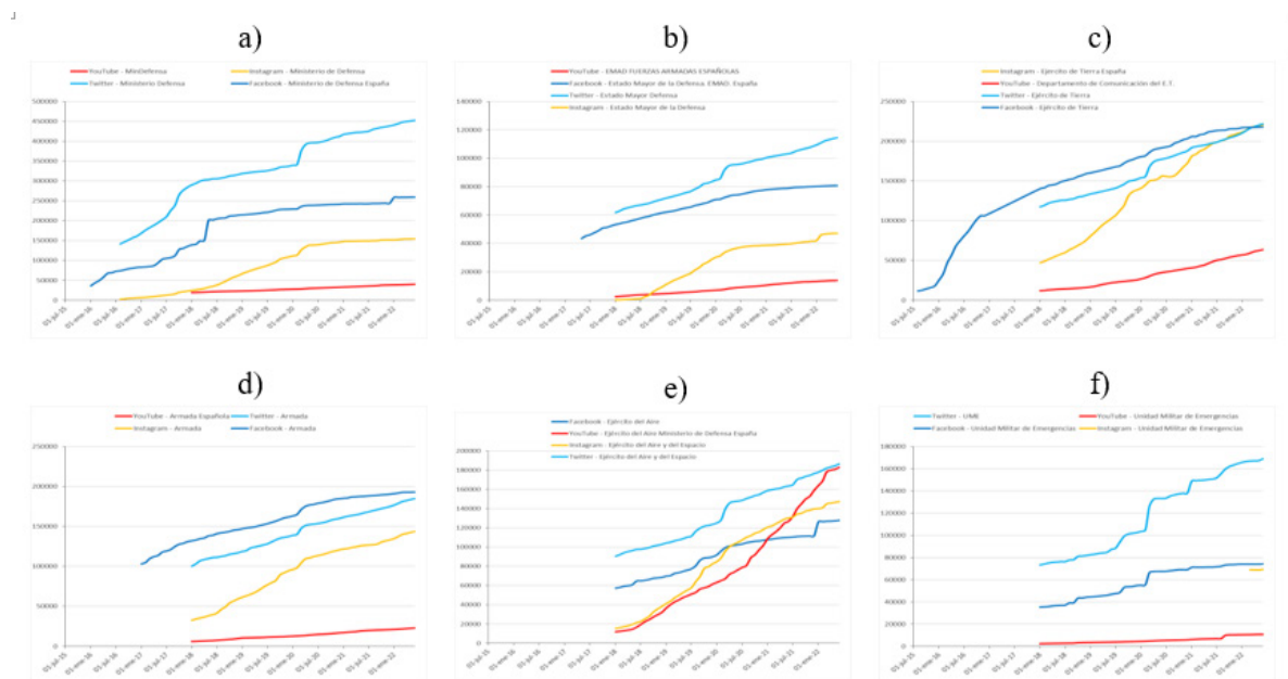
Figura 2. Evolución de seguidores de los perfiles en Facebook (azul oscuro), Twitter (azul claro), Instagram (amarillo) y YouTube (rojo; suscriptores) de: a) Ministerio de Defensa; b) Estado Mayor de la Defensa; c) Ejército de Tierra; d) Armada; e) Ejército del Aire y del Espacio; f) Unidad Militar de Emergencias.

primer trimestre de 2020, coincidiendo con el despliegue de los perfiles y el crecimiento de la popularidad de la plataforma, y un crecimiento en paralelo al experimentado en las demás plataformas a partir de mediados de 2020, en una etapa de madurez. YouTube es la cuenta, para cada organización, con menor seguimiento, a excepción del Ejército del Aire y del Espacio, que ha sostenido un alto ritmo de crecimiento de suscriptores desde 2018 en la plataforma de vídeos y ha situado su canal a la par de seguidores que su cuenta más popular, la de Twitter, superando a la de Facebook a principios de 2021 y a la de Instagram a mediados de ese año.