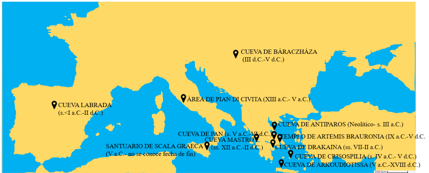
Fig. 3: Cartografía de las cuevas asociadas a Artemis/Diana