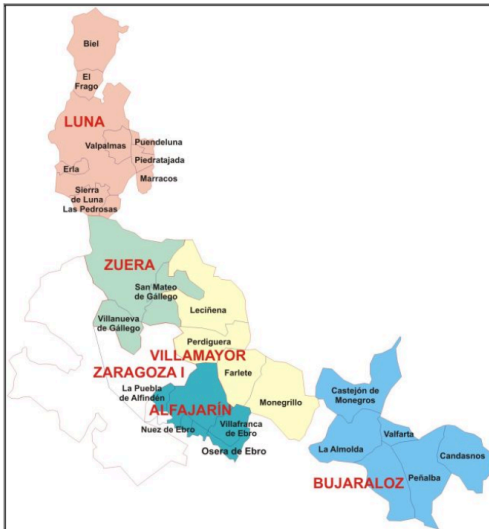
Imagen 1: Mapa Sector I Sanitario Zaragoza: