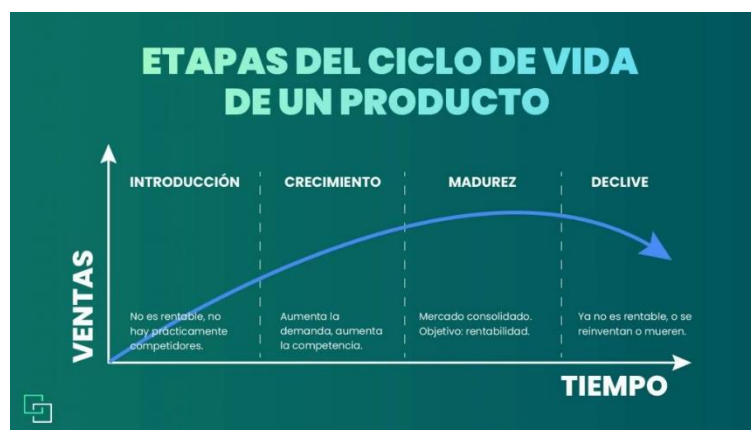
Tabla 5: Ciclo de vida de un producto, extraído de la página The Power Education

En nuestro caso consideramos que nos encontramos en la etapa de nacimiento, ya que comienza su constitución y funcionamiento, además requiere de una gran inversión inicial y de una buena labor comercial para conseguir los primeros clientes.