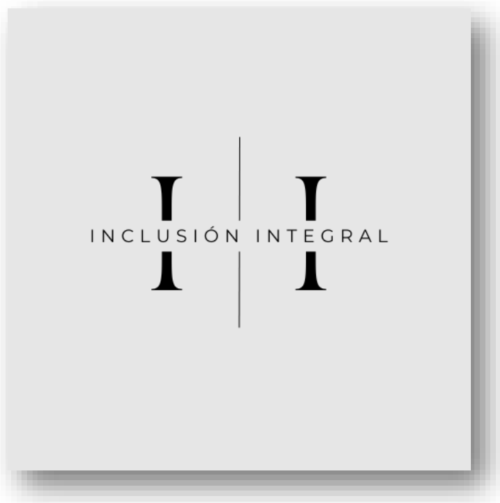
Ilustración 1: Logo de la empresa de elaboración propia