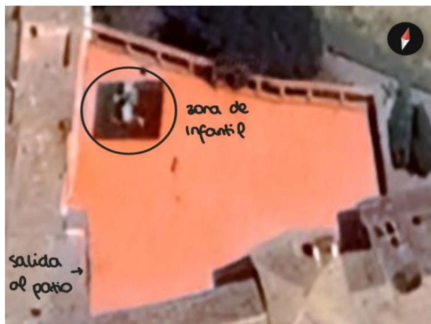
Imagen 1. Patio de recreo actual vista aérea.

El patio de recreo actual posee unas dimensiones totales de 680 metros cuadrados el cual posee una zona delimitada con un parque de juegos infantil y todo lo demás es una explanada lisa tal y como se observa en la Imagen 1 .