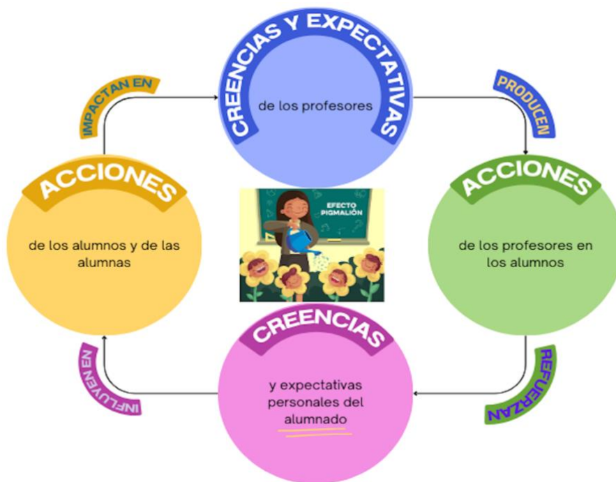
Figura 1: Efecto Pigmalión. Elaboración Propia.

al alumnado a desarrollar e involucrar en sus vidas las habilidades socioemocionales. Además, se debe ser consciente por parte de los maestros que los alumnos no comienzan el colegio sabiendo gestionar sus propias emociones, y por ello, se les debe enseñar habilidades emocionales ampliando y desarrollando su cerebro. Por lo que la clave principal de la disciplina positiva es centrarse en el potencial del alumnado y dedicar la mayor parte del tiempo a desarrollar en ellos mismos el conocimiento y ejecución de habilidades emocionales. De esta manera, se debe comenzar a enseñar a partir de fortalezas, es decir, creyendo en los alumnos, y de esta manera, ellos serán capaces de creer en ellos mismos, a través del efecto Pigmalión .