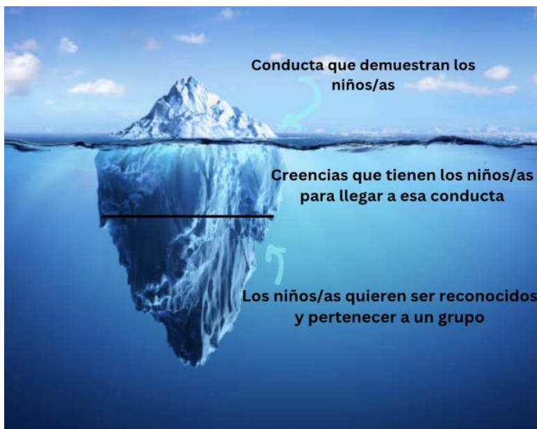
Figura 3: Teoría del modelo conductual. Elaboración propia.

Por ello, los adultos deben saber ver más allá de lo que los niños y niñas demuestran en sus actos diarios, y esto puede ser contemplado gracias a la teoría que expuso Rudolf Dreikurs para explicar la conducta de los estudiantes creando una comparación con la estructura que compone a un iceberg, como se puede ver a continuación en la siguiente imagen representativa de lo que resume la teoría: