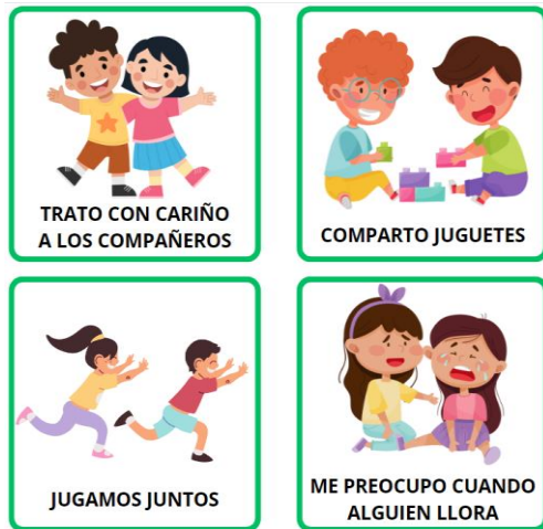
Soy empático cuando...