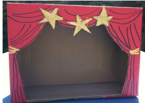
Ambientación del Teatro