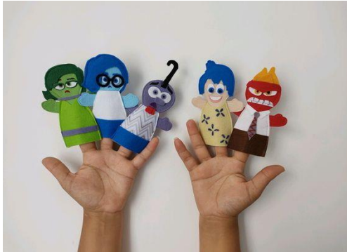
Marionetas Inside Out.