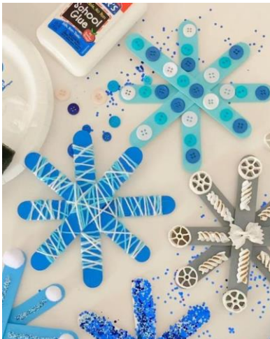
Ejemplo de copos de nieve