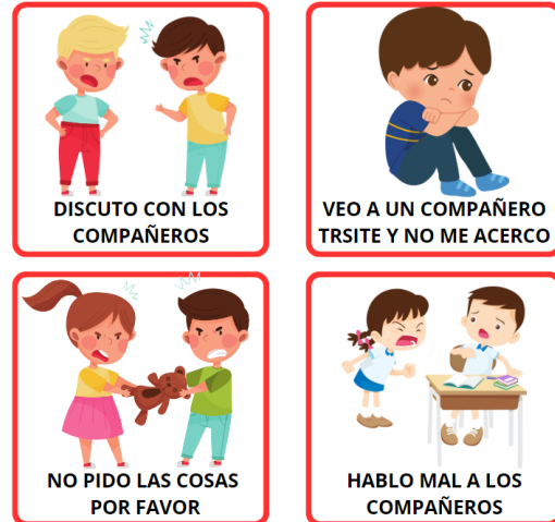
No soy empático cuando...