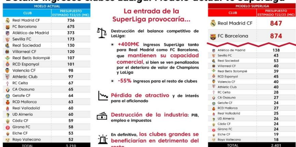
Ilustración 3: Detalle ingresos clubs LaLiga: Modelo actual vs Superliga.

Es necesario también, tal y como ha revelado el Parlamento Europeo tratar de perseguir un modelo europeo del deporte que reconozca la necesidad de un compromiso sólido con la integración de “los valores de solidaridad, sostenibilidad, inclusión, competencia abierta, mérito deportivo y equidad de la UE” 22 . Por eso, el Parlamento Europeo se opone firmemente a las “competiciones escindidas” que socavan estos principios y ponen en riesgo la estabilidad general del ecosistema deportivo, como podría serlo la Superliga.