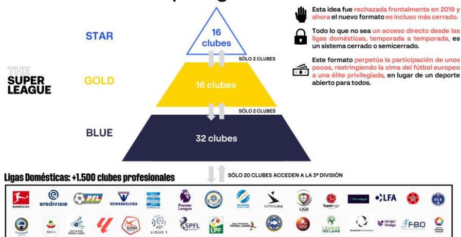
Ilustración 2: El nuevo formato de competición presentado por la Superliga.

El pilar fundamental se halla en la gobernanza y toma de decisiones, y es que a diferencia de la Champions League que es totalmente intervenida y controlada por la UEFA, la Superliga sería dirigida únicamente por los clubs participantes en esta sin ningún tipo de intermediario.