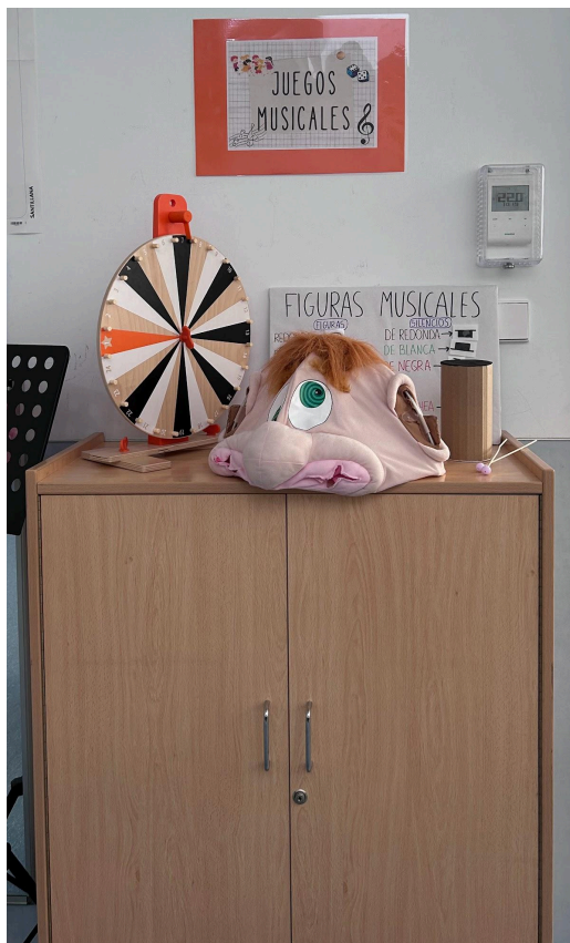
Figura 5. Los juegos musicales