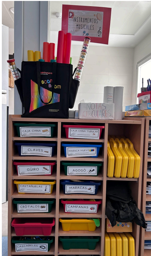
Figura 3. Los instrumentos musicales