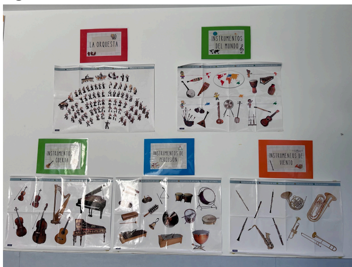
Figura 4. Las familias de los instrumentos