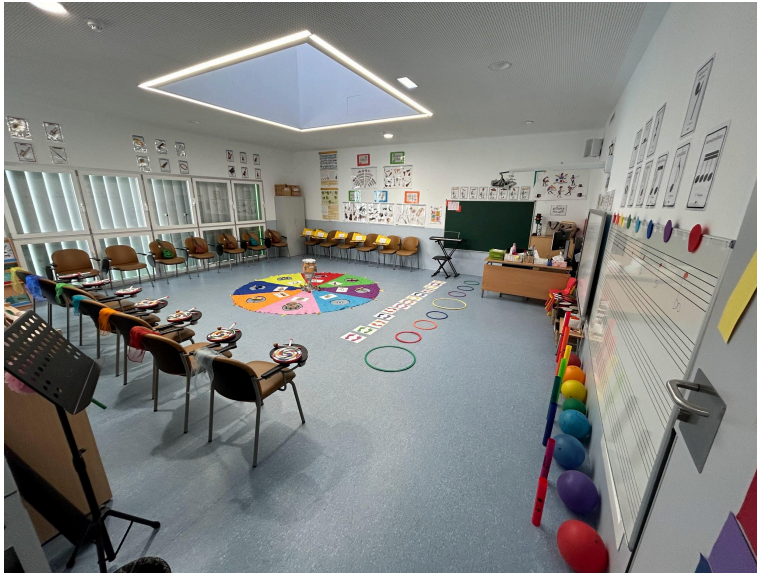
Figura 1. Fotografía de la clase de referencia.