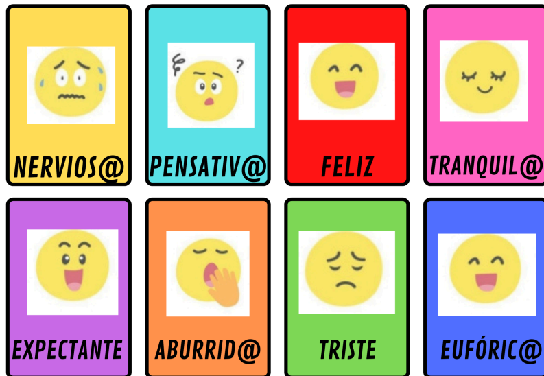
Figura 7. Tarjetas de emociones