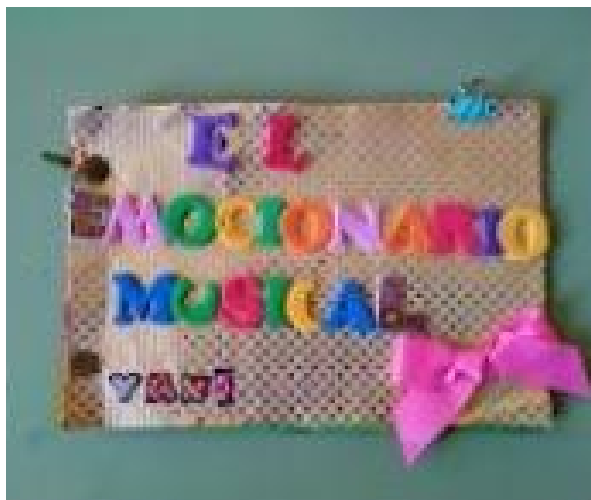
Figura 6. Posible emocionario musical