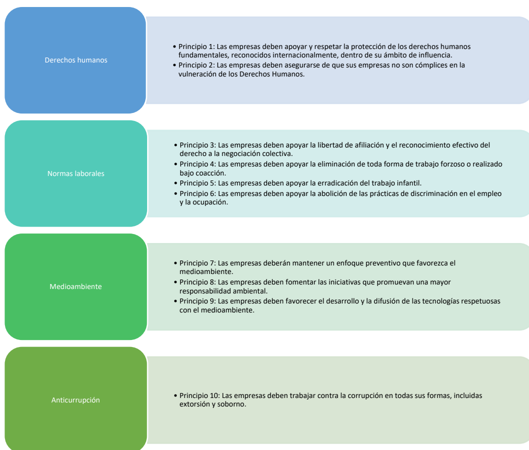
Ilustración 1. Los 10 principios universales del Pacto Global de las Naciones Unidas. Elaboración: propia.