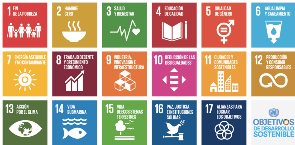
Ilustración 2. Los Objetivos de Desarrollo Sostenible. Elaboración (UNESCO, 2015)

Aunque no todos los países han firmado este acuerdo, por ejemplo; Arabia Saudí, Armenia, Benín, Birmania, Cabo Verde, Chile, Siria, Ecuador, Irak, Kazakstán, Corea del Norte entre otros.